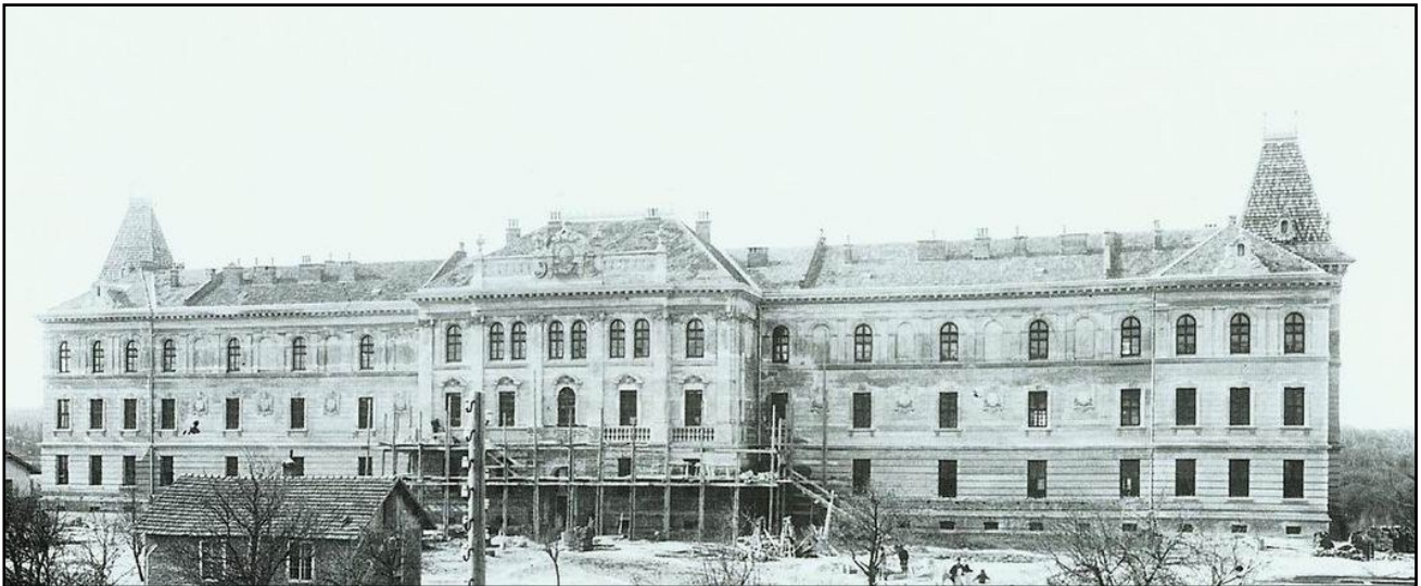
Рис. 2. Новозбудований корпус клініки шпиталю на вул. Піярів (1895) (тепер вул. Некрасова у Львові)

Активно займався професор Мерунович громадською діяльністю. У 1885–1886 рр. – голова Львівської секції Товариства галицьких лікарів (ТГЛ); у 1895–1910 рр. – голова ТГЛ, пізніше був почесним членом