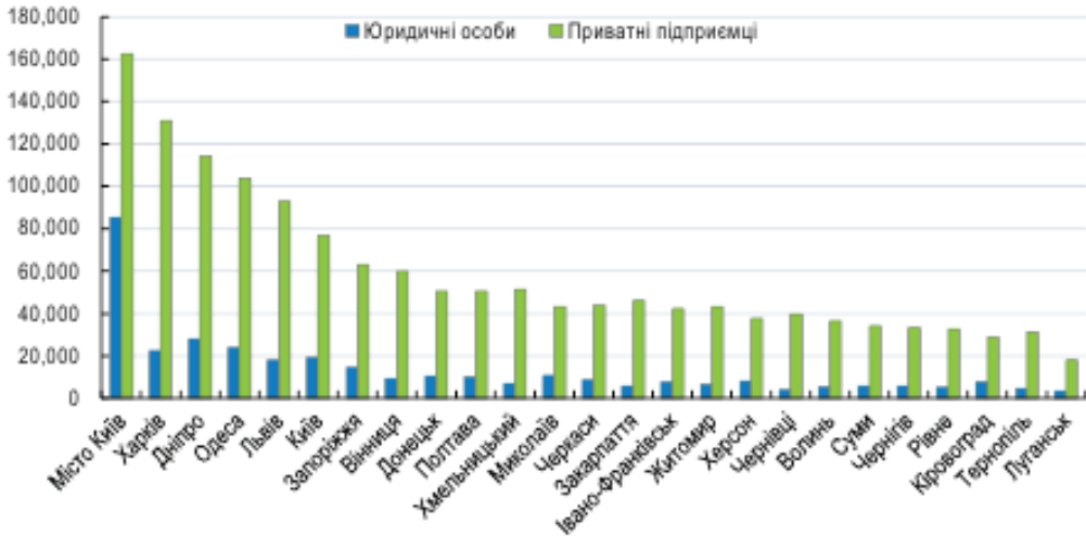
Рис. 1. Кількість підприємств по областях за організаційно-правовою формою (Вся економіка, включно банки 2017 р.) [6, с. 27]

За кількістю середніх підприємств Харківська область посідає 3-є місце після м. Київ і Дніпропетровської області та 4-е місце за кількістю малих підприємств після м. Київ, Дніпропетровської та Одеської областей [5].