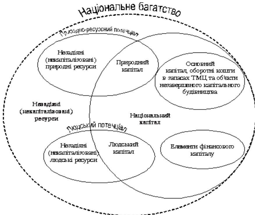
Рис. 2. Национальний капітал і незадіяні (некапіталізовані) ресурси на основі двоаспектного підходу до дослідження національного багатства, авторська розробка

багатства, яка за його найнижчих обсягів допомагатиме підтримувати високу його ефективність. Оптимальна структура НБ має зводити до мінімуму його фондомісткість у виробництві ВВП і водночас забезпечувати ефективний процес розвитку національної економіки та продуктивність національного багатства. Оптимізувати структуру національного багатства можна, зокрема, за рахунок збільшення людського капіталу, підвищення його ефективності й зменшення частки низьколіквідних оборотних активів – незавершеного виробництва, сировини, матеріалів тощо. Для оптимізації структури національного багатства за напрямками вкладення необхідно побудувати інтегральний показник ефективності функціонування його елементів за допомогою методів економіко-математичного моделювання.