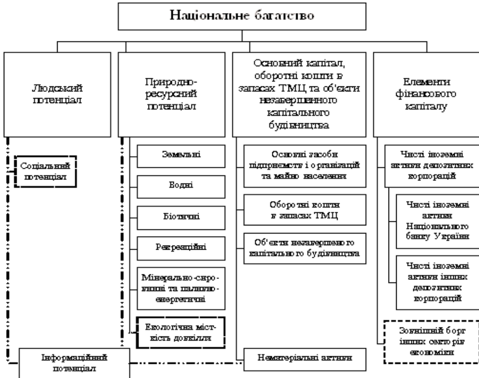
Рис. 1. Класифікація елементів національного багатства, авторська розробка

банку України та інших депозитарних корпорацій) і зовнішній борг інших секторів економіки). Досить специфічним елементом національного багатства, вагомість якого в сучасному житті суспільства постійно зростає, є інформаційний потенціал країни.