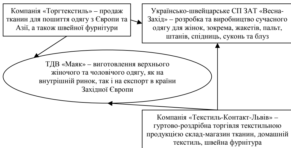
Рис. 3. Рекомендована структура формування в Львові швейного кластера «Еліт Клоувз», авторська розробка

Структуру запропонованого кластера «Еліт Клоувз» наведена на рис. 3.