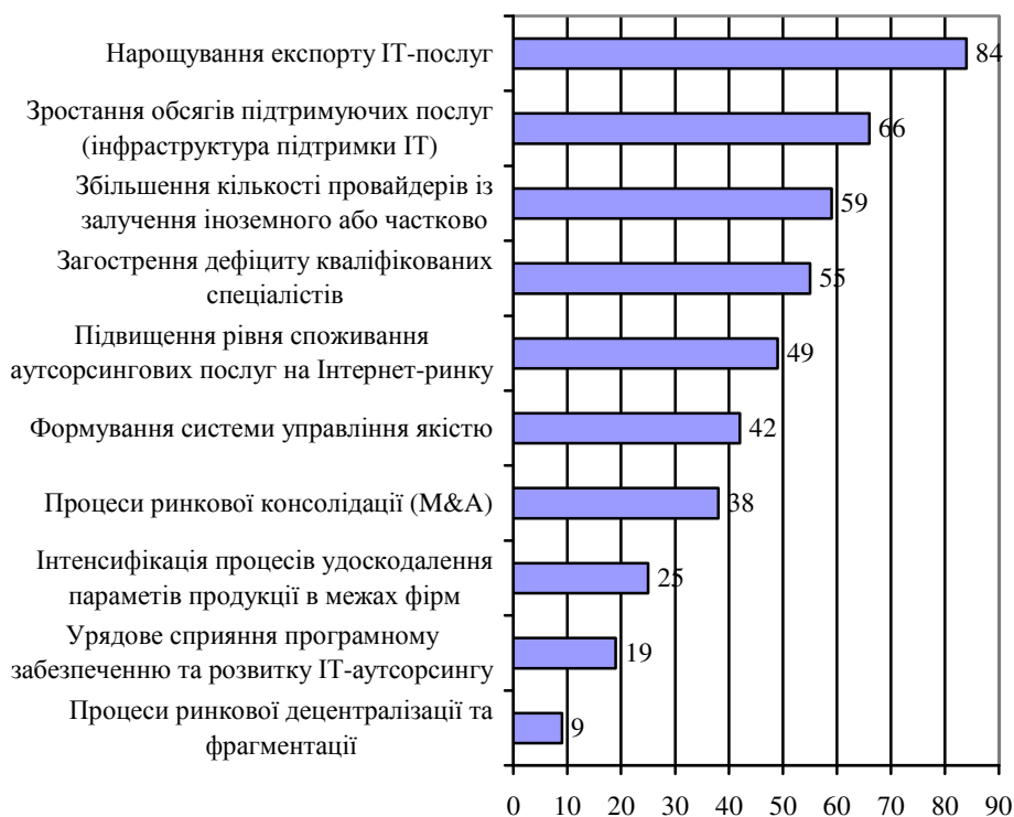
Рис. 3. Сучасні тенденції у сфері аутсорсингу IT-послуг України (питома частка позитивних відповідей респондентів, %), побудовано за даними [8, 42]

суттєвий вплив мають такі чинники: залучення до глобальних логістичних мереж, кон'юнктура ринків, рівень ефективності логістичного управління, зміни в економічній політиці. За таких умов підприємства вимушені використовувати конкурентні стратегії з метою зменшення рівня невизначеності та ризику. Недостатня поінформованість щодо ринкової кон'юнктури впливає на рівень виваженості управлінських рішень і в сфері логістики. Одним із дієвих інструментів досягнення стійкого економічного росту, на нашу думку, є розвиток сфери логістичних аутсорсингових послуг. Поєднання засобів інсорсингу та механізмів логістичного аутсорсингу є передумовою здобуття глобальних конкурентних переваг вітчизняних підприємств (рис. 4).