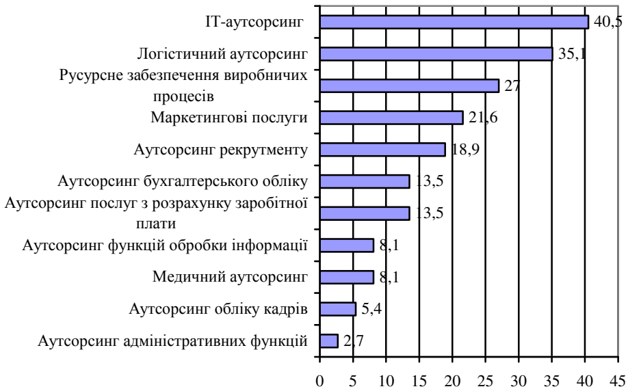
Рис. 2. Рейтинг аутсорсингових бізнес-процесів в Україні, побудовано за даними [1]

Логістичні технології стають дедалі складнішими. Нині важливо швидко реагувати на зміни параметрів маркетингових чинників та ринкової кон'юнктури. Виваженість управлінських рішень безпосередньо залежить від поінформованості щодо ринкової кон'юнктури. Вплив глобальних конкурентних сил і відповідні технологічні зміни зумовлюють широке застосування ІТ аутсорсингових послуг. Серед сучасних тенденцій в сфері ІТ аутсорсингових послуг України слід відзначити нарощування експорту ІТ послуг; зростання обсягів підтримуючих послуг (інфраструктура підтримки ІТ); збільшення кількості провайдерів із залученням іноземного або частково іноземного капіталу; загострення дефіциту кваліфікованих спеціалістів; підвищення рівня споживання аутсорсингових послуг на Інтернет-ринку; формування систем управління якістю; процеси ринкової консолідації (М&А); інтенсифікацію процесів удосконалення параметрів продукції в межах окремих фірм; урядове сприяння програмному забезпеченню та розвитку ІТ аутсорсингу; а також процеси ринкової децентралізації та фрагментації (рис. 3).