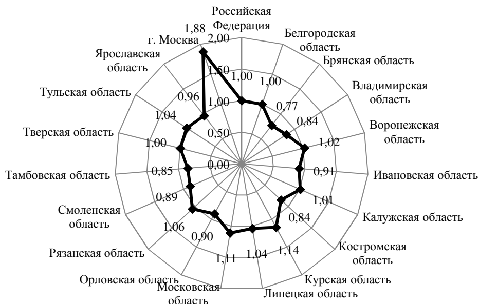
Рис. 1. Ресурсный профиль регионов Центрального федерального округа в 2014 г., рассчитано по данным [4; 15]

Домашние хозяйства участвуют в процессе капитализации, используя часть своих доходов для приобретения капитальных и финансовых активов. Исходя из этого, объем капитализации домашних хозяйств региона достаточно репрезентативно оценивается суммой доходов, вложенных ими за год в приобретение недвижимости и прирост финансовых активов.