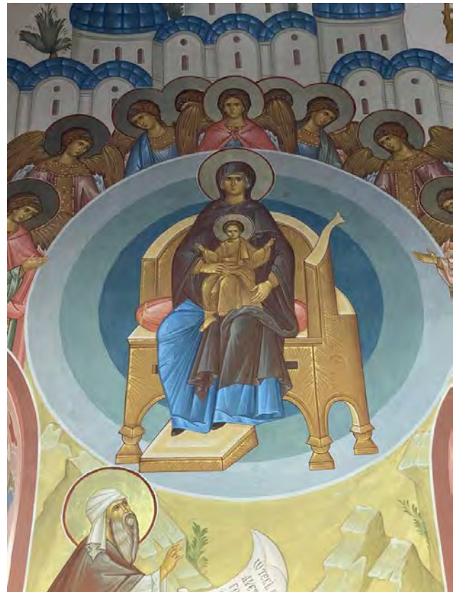
Рис. 7. Є. Ільїн. Про Тебе радіє. Фрагмент. Розписи хорів. Червень – листопад 2017 р.

Провідною тематико-сюжетною лінією храмової декорації є ушавлення Пресвятої Богородиці. Її послідовно розкривають композиції, пов'язані з життєм і акафістом. Це – лики пророків і праведників, які свідчили про прихід Спасителя, а також царів, адже Діва Марія походила з роду пророка-царя Давида. Це – сюжети, що ілюструють Її народження, дитинство, введення у храм, Благовіщення, Її Успіння. Прославляють Царицю