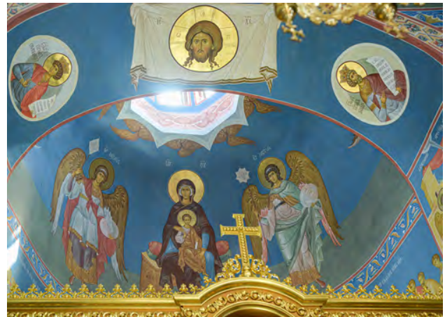
Рис. 5. В. Прокопчук. Богородиця на троні з Немовлям Христом і предстоячими архангелами Михаїлом і Гавриїлом. Розписи вітварної апсиди. І. Ільїн. Спас Нерукотворний. М. Шиптя. Пророки. Розписи передвітарної арки. Червень – листопад 2017 р.

В. Прокопчук написав Христа Пантократора у скуфії центрального купола; на парусах: В. Преображенський і В. Прокопчук – апостола і євангеліста Іоанна Богослова, І. Ільїн – євангелістів Марка та Луку, І. Бруховець – євангеліста Матфея. На схилах склепіння: на східному – «Сходження Святого Духа на апостолів» – І. Бруховець, Р. Сазонов; на південному – «Різдво Богородиці» – В. Прокопчук; на північному – «Різдво Христово» – О. Поліщук, І. Бруховець; на західному – «Успіння Богородиці» – І. Ільїн.