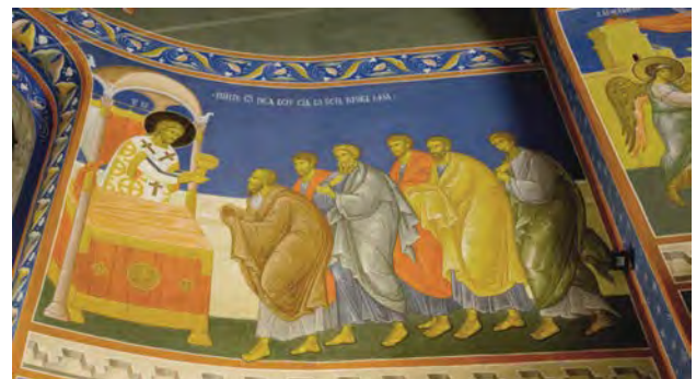
Рис. 6. Денниця. Причастя апостолів вином. Тасмна вечеря. Фрагмент. Розписи вітваря. Червень – листопад 2017 р.

Розписи на стінах розташовані трьома регістрами. Верхній регістр займають поясні зображення праотців, старозавітних праведників, пророків, яких написали І. Бруховець, О. Поліщук і Р. Сазонов.