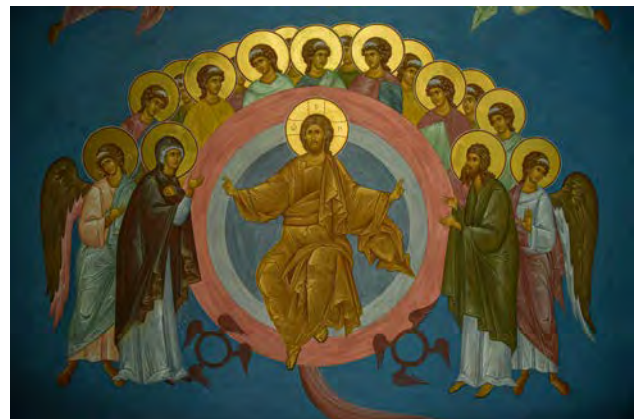
Рис. 8. В. Преображенський. Страшний суд. Фрагмент. Розписи західної частини церкви. Червень – листопад 2017 р.

Небесну Її зображення на троні із Христом Дитиною, розташовані в апсиді та на хорах. На хорах тема ушавлення органічно проілюстрована акафістом, куди включені образи преподобних Печерських. Опосередковано ушавленню Богородиці служать зображення Христа – Христа Еммануїла у вівтарі, «Різдва Христового» навпроти «Різдва Богородиці», зображення Заступниці за рід людський у композиції «Страшний суд».