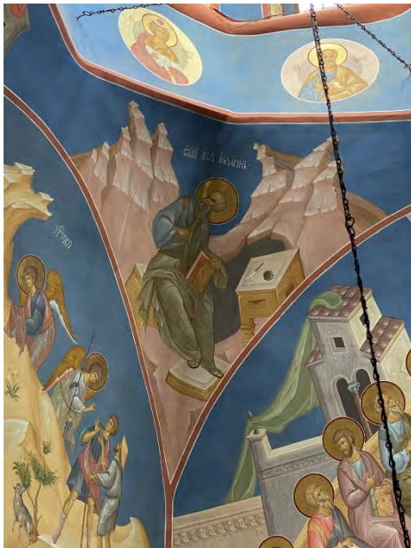
Рис. 4. В. Преображенський, В. Прокопчук. Апостол і євангеліст Іоанн Богослов. Розписи північно-східного паруса центрального купола. Червень – листопад 2017 р.