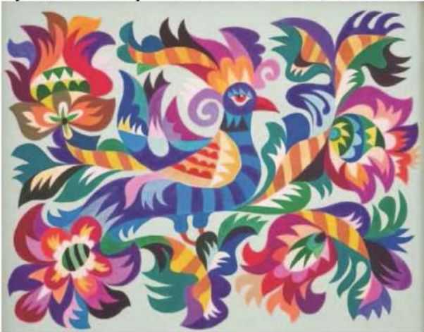
Рис. 1. Невідомий автор. Композиція «Голуб»

хвилеподібно продовжується, переходячи у фантастичну квітку. Лінія черева паралельно лінії спини теж переходить у квітку, грайливо вигинаючись, утворює верхній силует пелюстки. Між верхньою лінією птаха і його низом незримо відчувається композиційна вісь прекрасної квітки, яка є композиційним завершенням хвоста. Від центра червоної частини птаха вліво, плавно вигинаючись, тягнеться композиційна лінія гілки, якоїсь фантастичної рослини, навколо якої розвивається динамічний силует синіх, зелених, темно-синіх та фіолетових пелюсток у верхній частині та зелених і чорних – у нижній. Посередині цієї гілки із зеленого зародка виросла прекрасна квітка фіолетового кольору, у яку вписано елементи у зелених і блакитних кольорах. Квітка є просто втіленням краси, а краса – це завжди хвилювання. Якраз хвиля породила нестримну фантазію художника. Він керувався не ustalеними правилами композиції, а своїми почуттями і відчуттями гармонії, натхненням.