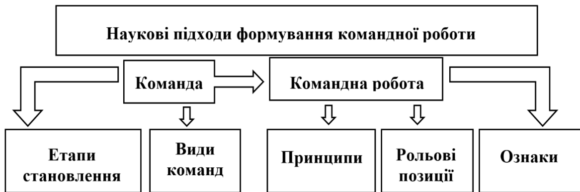
Рис.3 Структура командної роботи

Проведений аналіз наукових джерел дає можливість змоделювати структуру командної роботи, рис.3.