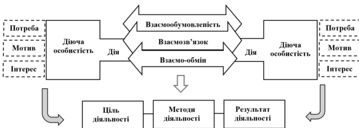
Рис.2 Структура процесу взаємодії у команді.

Аналіз наукової літератури дав можливість простежити зв'язок між командною роботою та взаємодією, в результаті чого встановлено родовий зв'язок між поняттями, а саме термін «взаємодія» вважається родовим для терміну «командна робота» тому, що основа роботи команди базується на взаємодії її учасників, однак дана взаємодія, має виключно характер співробітництва, що зумовлює виокремлення поняття командної роботи як позитивного виду взаємодії. Керуючись поданою структурою процесу взаємодії рис.1 в контексті командної роботи важливо доповнити структуру командної взаємодії фактом узгодження власних потреб, мотивів та інтересів учасників команди із загальною метою командної роботи, схематично взаємодію команди можна зобразити наступним чином, рис.2.