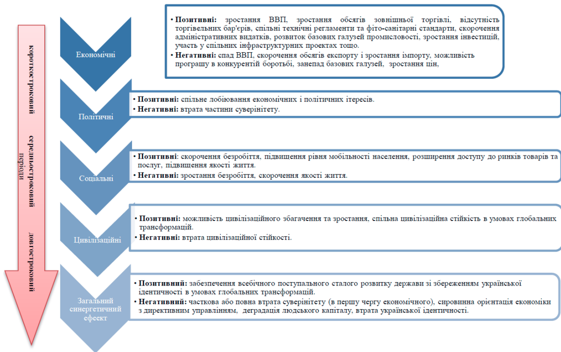
Рис. 1 Категоризація ефектів від приєднання України до економічних угруповань Примітка. Схему складено особисто автором.

Виклад основного матеріалу дослідження. Інтеграційний вибір будь-якої країни призводить до формування позитивних або негативних економічних, політичних, соціальних і цивілізаційних ефектів, що в комплексі утворюють загальний синергетичний ефект від інтеграції (рис. 1).