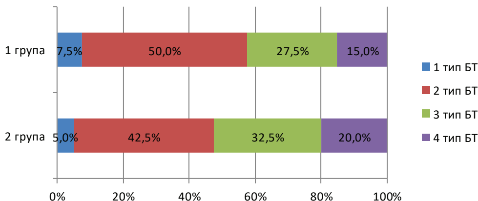
Рис. 2. Характеристика базальної температури в обстежуваних жінок, %.

реважають ановуляторні цикли, або НЛФ, які вимагають гормональної корекції.