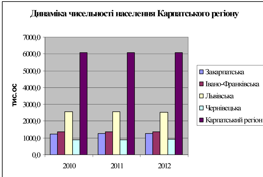
Рис. 1. Динаміка чисельності населення Карпатського регіону*