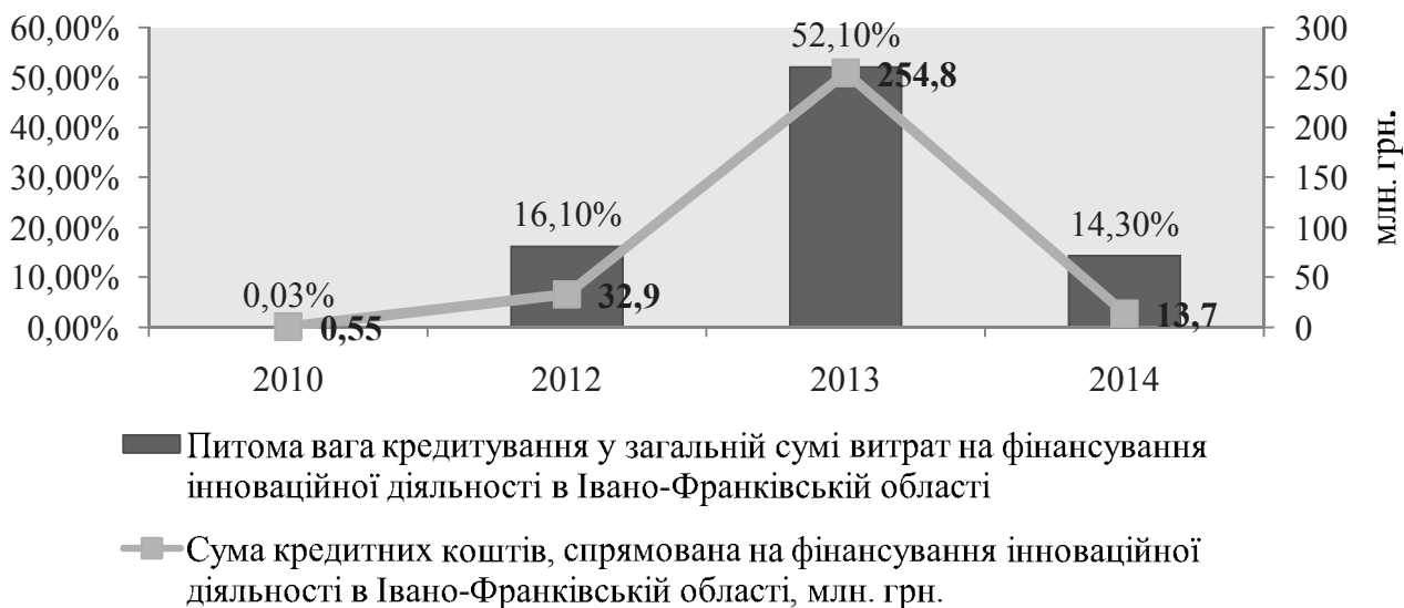
Рис. 3. Динаміка фінансування інновацій за рахунок кредитних коштів у Івано-Франківській області*