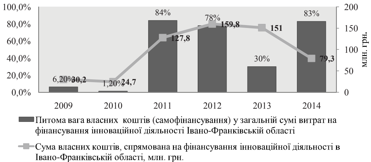
Рис. 2. Динаміка фінансування інновацій за рахунок власних коштів у Івано-Франківській області*

На рис. 2. відображена динаміка питомої ваги власних коштів (самофінансування) у загальній сумі витрат на фінансування інноваційної діяльності Івано-Франківській області за 2009-2014 рр.