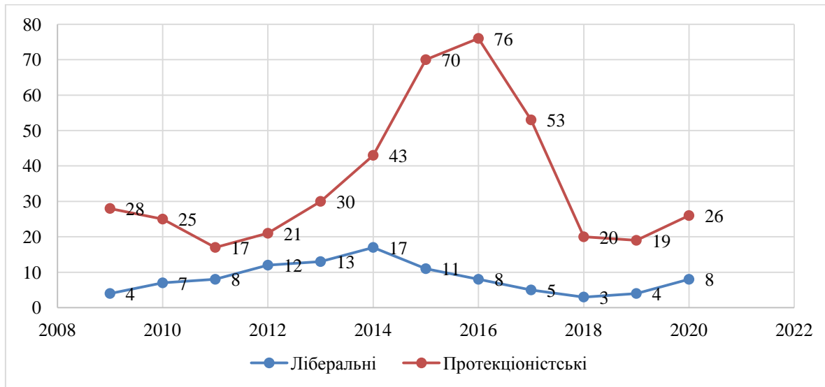
Рис. 2. Кількість інтервенцій в торговельно-економічні відносини України Російською Федерацією, 2008-2020 рр.

обмеженню інвестиційної активності, фінансові заходи, субсидування, антидемпінгові заходи, експортні квоти, тарифні заходи, захист інтелектуальної власності, тощо.