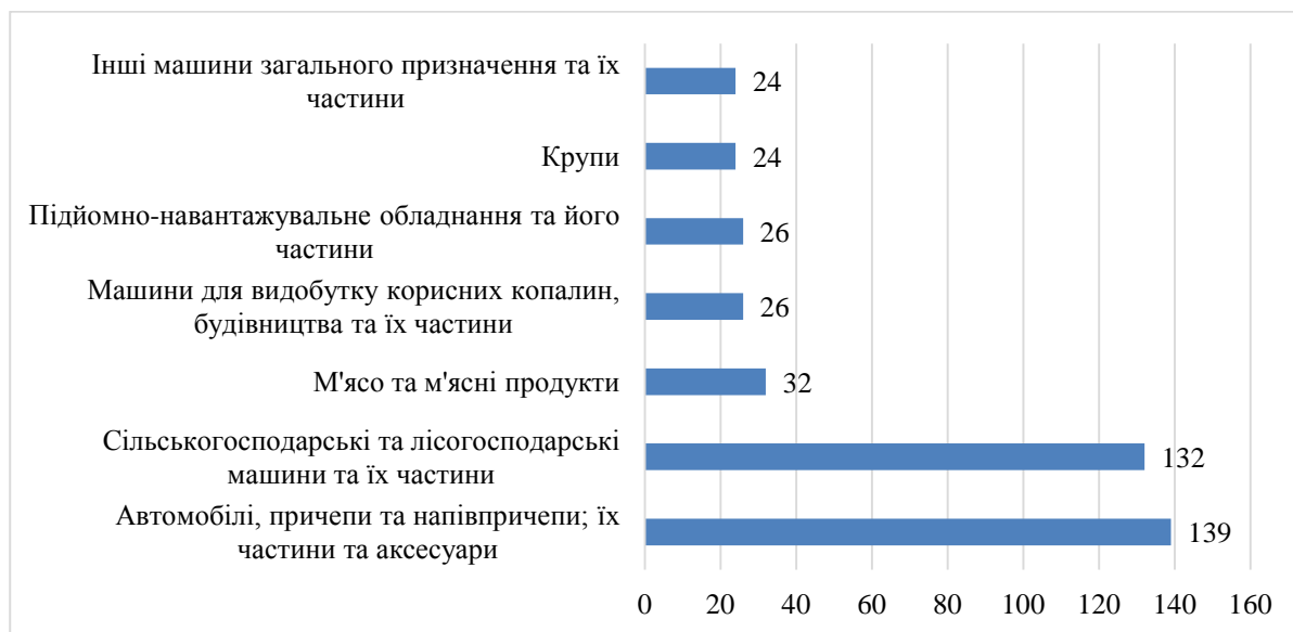
Рис. 3. Кількість негативних втручань в торговельно-економічні відносини України Російською Федерацією, 2010-2020 рр.

Наслідком такої ґрунтовної стратегічної політики стало суттєве зростання товарних груп, які підпадають під торговельні обмеження (рис. 3.). Найбільших обмежень зазнали машинобудівна та сільськогосподарські сфери, тісно пов'язані до 2014 року із російським ринком.