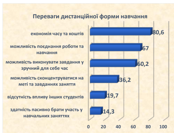
Рис. 3. Переваги дистанційної форми навчання

Зокрема, перше місце у перевагах займає позиція «економія часу та коштів» – понад 80% студентів це відмітили. Очевидно, доїзд до навчання є справжньою студентською проблемою, водночас можливість навчатися дистанційно дозволяє зекономити гроші. Друге місце зайняла позиція «можливість поєднувати навчання та роботу». Сьогодні багато студентів змушені працювати, оскільки, по-перше, стипендіальний фонд досить малий і лише незначна кількість студентів отримує стипендію, по-друге, на багатьох освітніх програмах небагато державних місць, тому можливість працювати є необхідністю, щоб оплатити власне навчання на обраній спеціальності. Третє місце посіла позиція «можливість виконувати завдання у зручний для себе час», її обрало трохи більше 60% опитаних. Деякі засоби, на зразок Moodle, справді дають можливість студенту обрати зручний час для виконання завдання. Під час очного навчання нерідко деякі чинники можуть заважати сприймати навчальну інформацію, саме тому на четверте місце серед переваг дистанційного навчання студенти обрали «можливість сконцентруватися на меті та завданнях» – понад 30% опитаних так вважають. Близько 20% здобувачів вищої освіти вважають, що дистанційне навчання дозволяє уникнути впливу інших студентів, що