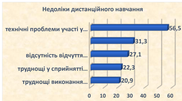
Рис. 4. Недоліки дистанційної форми навчання

Попри низку переваг дистанційного навчання, опитані студенти відмітили і низку її недоліків. Проаналізуємо п'ять найбільших недоліків такої форми навчання. На першому місці – «технічні проблеми участі у навчанні (нестійкий інтернет)», це визнали більше половини учасників. Цей недолік досить складно усунути, оскільки він не залежить ні від студента, ні від викладача. На другому місці опинилася позиція «виникають проблеми зі здоров'ям», це зауважило понад третина опитаних. Проблеми зі здоров'ям стосуються насамперед погіршення зору та постави. Дистанційна форма також виявила таку проблему, як почуття належності до студентської групи, зрештою, відчуття себе студентом. Майже третина опитаних не змогла відчути себе у студентському колективі. Отже, особиста присутність (очна) є важливою для студентів. До суттєвих недоліків дистанційного навчання здобувачі вищої освіти віднесли також «труднощі у сприйнятті лекційного матеріалу» (22,3%) і «труднощі виконання завдань на практичних, семінарських і лабораторних заняттях» (майже 21%). Щодо останньої позиції, то було розпорядження ректора про можливість очного проведення занять, якщо це необхідно при дотриманні карантинних обмежень (рис. 4).