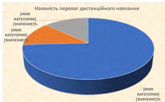
Рис. 2. Наявність переваг дистанційного навчання

Зокрема, перше місце у перевагах займає позиція «економія часу та коштів» – понад 80% студентів це відмітили. Очевидно, доїзд до навчання є справжньою студентською проблемою, водночас можливість навчатися дистанційно дозволяє зекономити гроші. Друге місце зайняла позиція «можливість поєднувати навчання та роботу». Сьогодні багато студентів змушені працювати, оскільки, по-перше, стипендіальний фонд досить малий і лише незначна кількість студентів отримує стипендію, по-друге, на багатьох освітніх програмах небагато державних місць, тому можливість працювати є необхідністю, щоб оплатити власне навчання на обраній спеціальності. Третє місце посіла позиція «можливість виконувати завдання у зручний для себе час», її обрало трохи більше 60% опитаних. Деякі засоби, на зразок Moodle, справді дають можливість студенту обрати зручний час для виконання завдання. Під час очного навчання нерідко деякі чинники можуть заважати сприймати навчальну інформацію, саме тому на четверте місце серед переваг дистанційного навчання студенти обрали «можливість сконцентруватися на меті та завданнях» – понад 30% опитаних так вважають. Близько 20% здобувачів вищої освіти вважають, що дистанційне навчання дозволяє уникнути впливу інших студентів, що