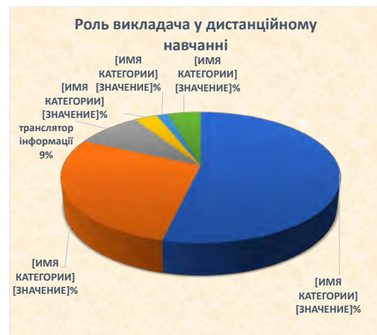
Рис. 6. Роль викладача у дистанційній формі навчання

Більше половини опитаних студентів вважають, що роль викладача у дистанційному навчанні є незмінною, майже для третини здобувачів вищої освіти викладач – це і транслятор, і консультант, 9% стверджують, що «пріоритетною роллю викладача у дистанційному навчанні є роль транслятора інформації», про те, що викладач – це «консультант», говорять дещо більше 3%, і менше 2% заявляють, що викладач передусім – це «контролер», близько 5% не визначилися із відповіддю на це запитання (рис. 6).