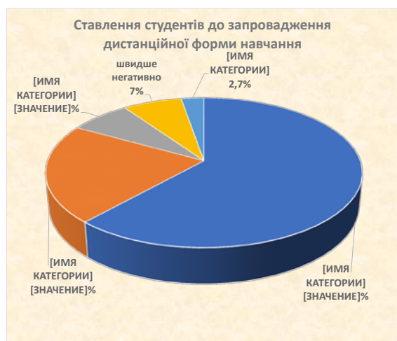
Рис. 1. Ставлення студентів до запровадження дистанційної форми навчання

Наступні запитання мали на меті визначити переваги та недоліки дистанційної форми навчання.