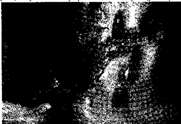
Рис. 1. Тройничный узел плода на 16 - 18 неделях внутриутробного развития (тройничная полость вскрыта).

В периоды 16-18 и 20-23 недель внутриутробного развития значительных изменений в наружном строении тройничного узла не наблюдается, однако за счёт увеличения его линейных размеров представляется возможным на макромикроскопическом уровне более детально изучить его строение. Так, следует отметить, что по сравнению с предыдущим периодом внутриутробного развития, за счет приоритетного увеличения поперечного размера тройничный узел начинает более отчетливо дифференцироваться от ствола тройничного нерва и начиная с 16-18 недель в некотором приближении принимает вытянутую треугольную форму, верхушкой обращенную к стволу тройничного нерва (рис.1).