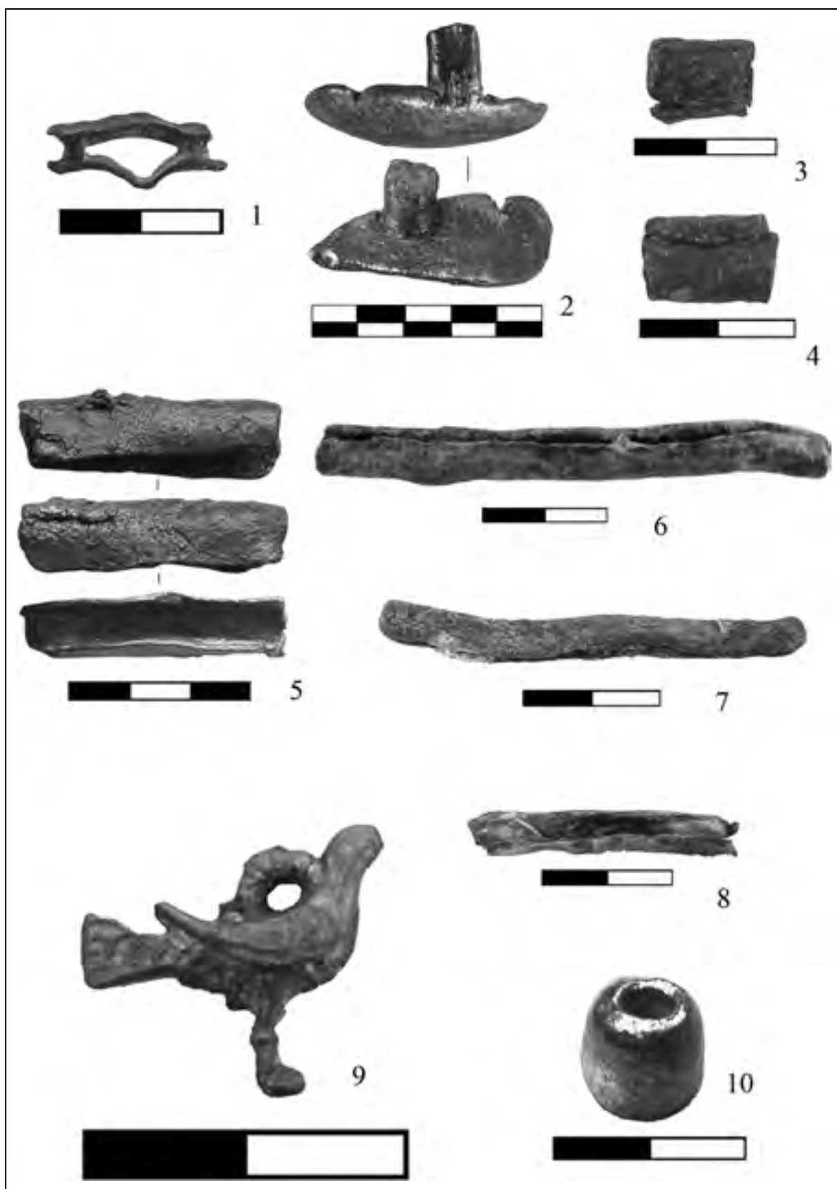
Рис. 2. Свинцовые изделия промышленного предназначения и украшения: 1 – 2 скрепы для ремонта посуды; 3 – 8 грузила для рыбацких сетей; 9 - подвеска в виде птички; 10 - бусина