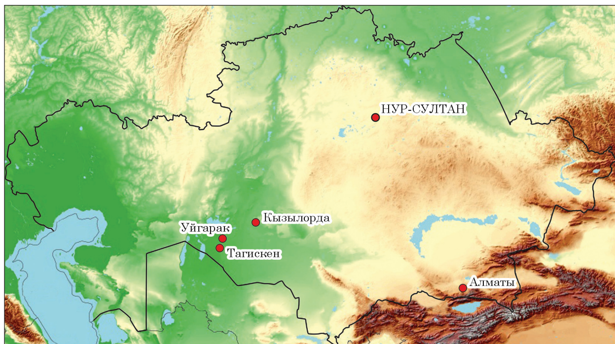
Рис. 1. Уйгарак и Тагискен на карте Казахстана. Исполнители: Н. Ш. Джуманазаров, М. А. Антонов

Благодаря успешному решению поставленных задач в рамках республиканской и региональной поддержки открыты яркие комплексы Таксай 1 и Талды 2, курган «Байгетобе», продолжение исследований берелских курганов и др. Эти события создают благодатные условия для анализа нового материала и возвращения к имеющемуся, как например, комплексы, изученные во второй половине XX в. на р. Инкардарье — притоке Сырдарьи в Восточном Приаралье (рис. 1).