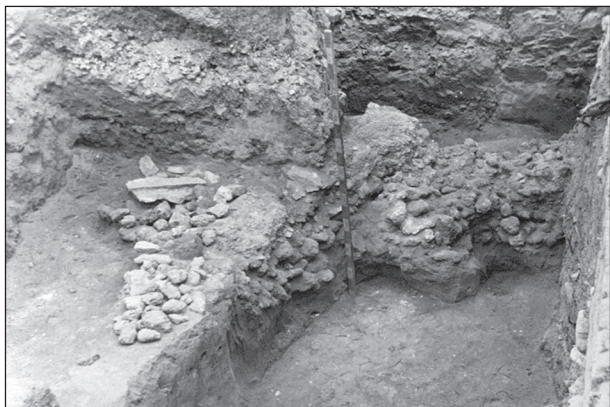
Рештки мурованої стіни Печерського монастиря XII ст. Розкопки В. А. Богусевича 1951 р. ДІКЗ «Киево-Печерська лавра» (Богусевич 1951а)

забудови давнього Києва, оскільки досі на території «міста Володимира» та на Михайлівській горі були виявлені лише напівземлянки стовпкової конструкції (Богусевич 1952d).