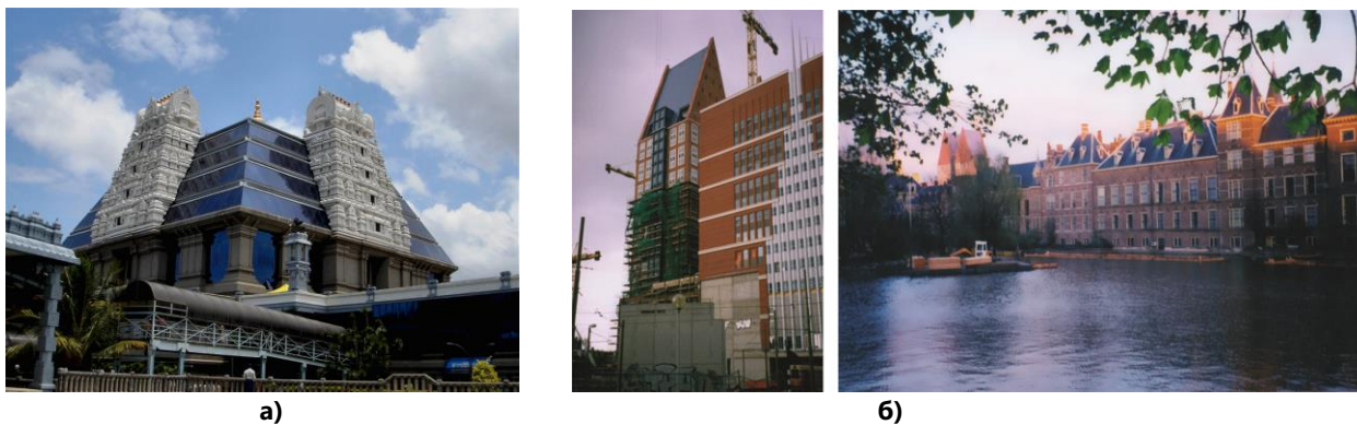
Рис. 3. Композиційно-просторовий рівень прояву національної ідентичності: а) буддійський храм в Дели; б) гармонійне включення нової висотної будівлі в історичний силует Гааги

Середовищна композиція поточною просторові комбінації, встановлює художньо-образні засоби етнодизайну, такі як кольорова гама, пропорції, акценти і нюанси та інші, що мають стати основою вже до предметного наповнення середовища від обладнання до витворів декоративно-прикладного мистецтва, обумовленого як народними традиціями, так і перспективними технологіями, що зроблять об'єкти дизайну більш комфортними та сучасними (рис. 3).