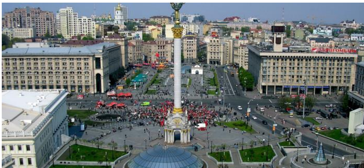
Рис. 1. Містобудівний ієрархічний рівень прояву національної ідентичності. Сучасна забудова та благоустрій Майдану Незалежності в Києві з ознаками української та глобальної ідентичності

Наступним ієрархічним рівнем є урбаністично-просторова організація, яка в конкретних параметрах втілена у відкритих і закритих міських просторах, їх плануванні, площах, висотах, конфігураціях тощо. Це втілення є містобудівним структурним блоком, який визначає місце і роль середовищного об'єкту у просторі поселення та його забудови з урахуванням різних природно-кліматичних та містобудівних умов розташування об'єкту дизайну, характеристиками оточуючого його природного і штучного середовища (рис. 1, рис. 2).