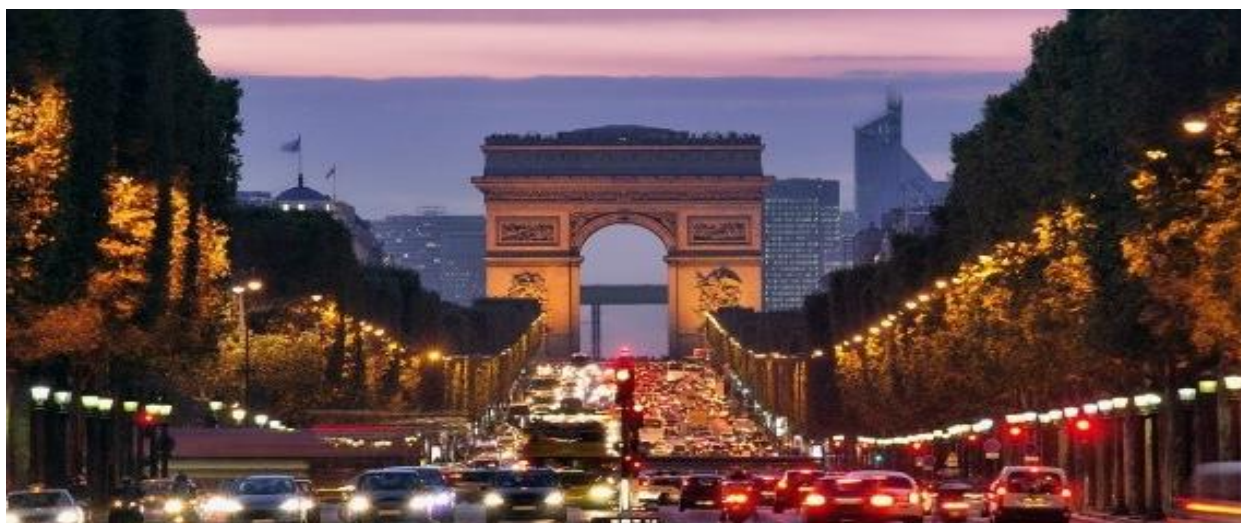
Рис. 2. Містобудівний ієрархічний рівень прояву національної ідентичності. Новий район Дефанс, увязаний віссю з відомою Триумфальною аркою в Парижі

Містобудівні умови розташування об'єктів дизайну разом із природно-географічними чинниками відіграють первісне визначальне значення як щодо народних традицій в архітектурі і містобудуванні, так і в продукуванні етнотрансформованих ідей та цінностей в умовах сучасної проектно-практичної діяльності. Так, природні і урбаністичні пейзажі карпатських, степових та приморських поселень України визначають в першу чергу відповідне формоутворення як відкритих, так і закритих (інтер'єрних) просторів середовища.