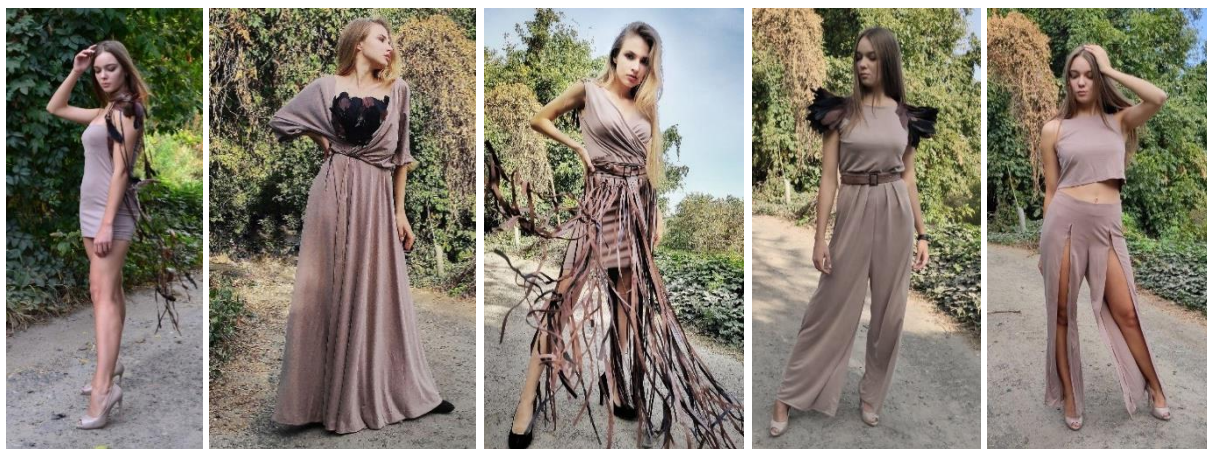
Рис. 9. Фото моделей одягу проектованої колекції «Сенс», автор Т.В. Пристав