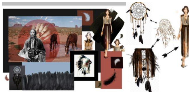
Рис. 6. Структурний аналіз та схема перетворення творчого джерела у костюмні форми колекції