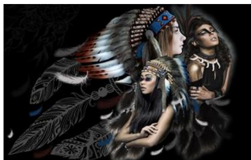
Рис. 5. Колаж творчого джерела для розробки колекції