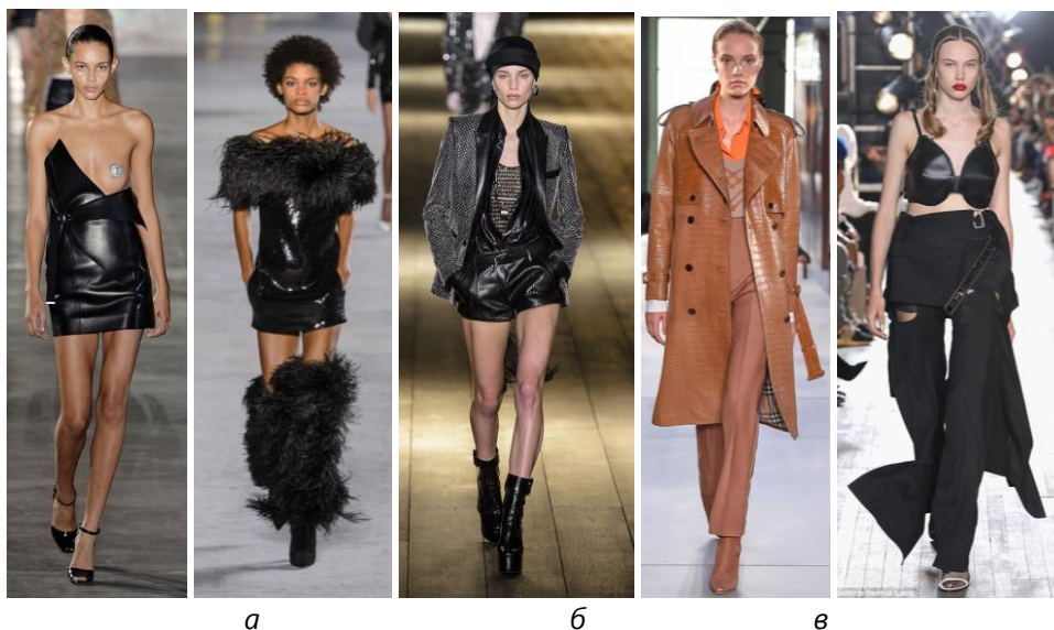
Рис. 1. Модель сукні бренду Saint Laurent (а), модель тренча бренду Burberry (б) та білизни бренду Helmut Lang (в) сезону SS19/20