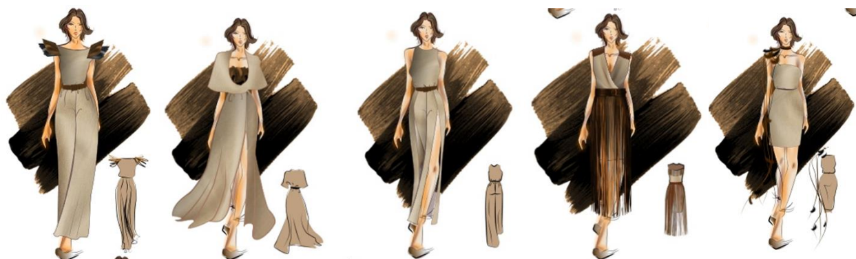
Рис. 7. Ескізи творчої колекції моделей жіночого одягу