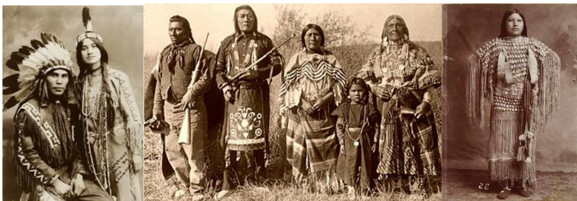
Рис. 3. Зображення народного костюма індіанців племен Навахо, Кроу, Лемонт Північної Америки з характерним оздобленням