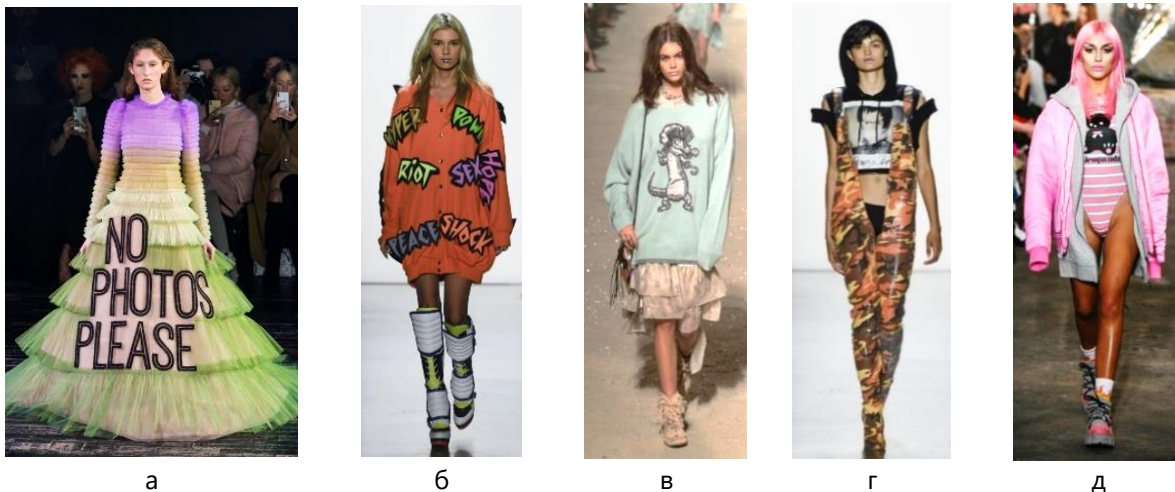
Рис. 1. Принти в одязі в стилі поп-арт (леттерінг, комікси та аніме) [6, 7]:

а – Viktor & Rolf Couture; б – Jeremy Scott; в – Coach 1941, г – Jeremy Scott, д – Nicopanda