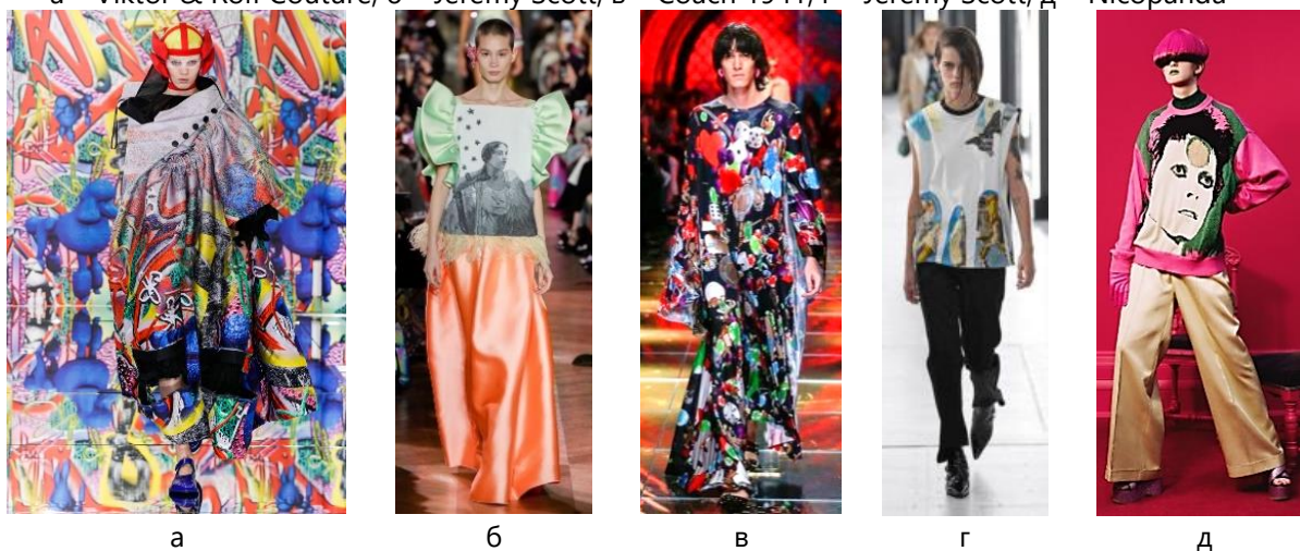
Рис. 2. Принти в одязі в стилі поп-арт (малюнки муралів та колажі) [6, 7]:

а – Viktor & Rolf Couture; б – Jeremy Scott; в – Coach 1941, г – Jeremy Scott, д – Nicopanda