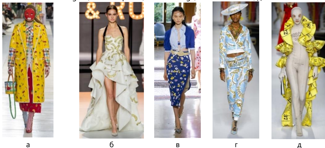
Рис. 3. Принти в одязі в стилі поп-арт (предметне зображення) [6, 7]:

а – Maison Margiela, б – Schiaparelli, в – Balenciaga, г – Louis Vuitton, д – Undercover