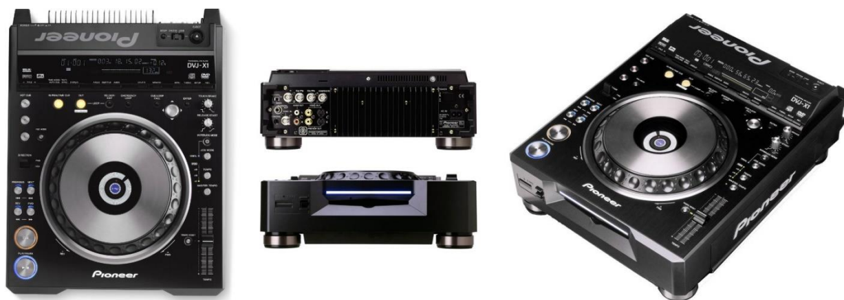
Рис. 3. Професійний DVD-програвач Pioneer DVJ-X1 (2004)

Hexstatic – англійський дует електронної музики Стюарта Уоррен Хілла і Робіна Брансона, що з уже згаданого 1997-го спеціалізується на створенні «химерного» аудіо-візуального електро. Виконавці зіграли важливу роль у розробці обладнання для VJ, включаючи професійний DVD-програвач Pioneer DVJ-X1 (рис. 3), що побачив світ у 2004. Стюарт Уоррен 2014 р. заснував компанію, що спеціалізується на виробництві голографічної плівки Hologauze, яка підтримує стереоскопічний 3D-ефект. Її поверхня дуже тонка й високовідбиваюча, і