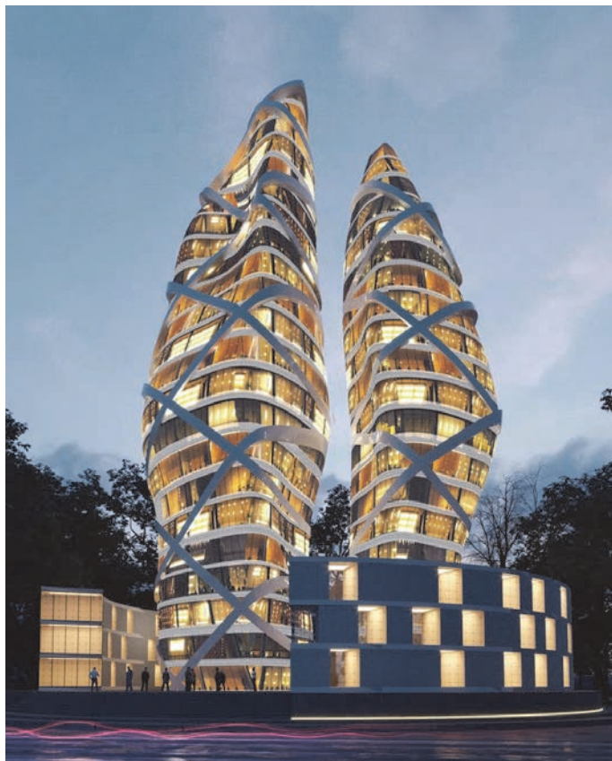
Рис. 2. Багатофункціональний житловий комплекс «Towers of love»

Перший вид інтеграції, а саме розташування на нижніх поверхах житлової будівлі передбачає досить широкий спектр суспільних функцій, вони відомі пересічній людині, так як зустрічаються в кожному місті, незалежно від кількості населення. До них відносяться, найчастіше, приміщення КБО, Останнім часом поширюється практика використання площі під дитячі садки, фітнес зали.