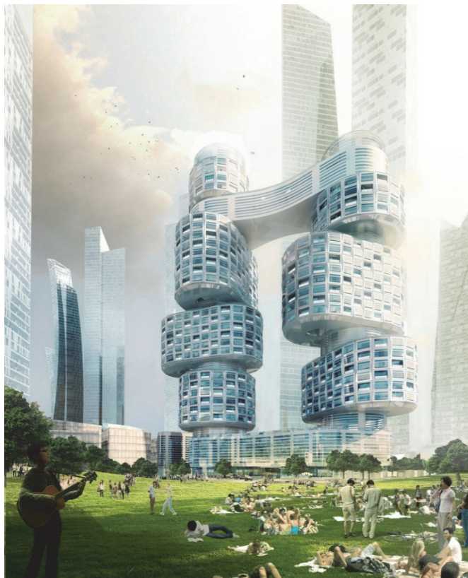
Рис. 4. Багатофункціональний житловий комплекс «Velo Towers»

Адже перебуваючи в синтезі з житловою структурою, воно є окремою архітектурною одиницею, що відкриває великі можливості в творчості при створенні цікавого житлового комплексу.