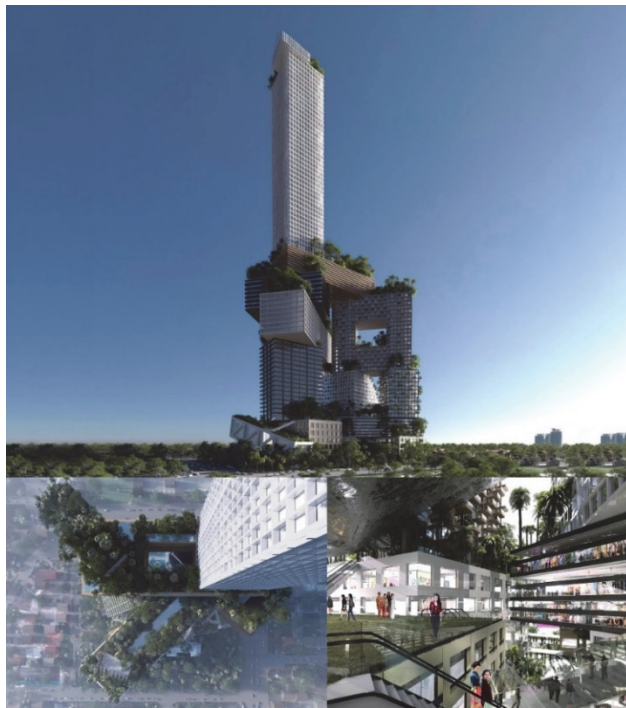
Рис. 3. Багатофункціональний житловий комплекс «Peruri 88»

Інтеграція суспільної функції в структуру житлового будинку в верхніх його поверхах найчастіше використовується при організації робочого / офісного простору. Виникнення coworking-центрів, популяризація будівництва будинків-майстерень і студій, - все це приклади такої інтеграції. В Європі цей досвід дуже поширений, проте, квартири-офіси зовсім не нове рішення. Російські підприємці дореволюційної епохи, лікарі і юристи теж, як правило, працювали там же, де і жили. З приходом до влади пролетаріату все змінилося. Навіть від такого привілею, як кабінет, багатьом довелося відмовитися. На цьому історія апартamentів, в яких офіс і житло об'єднані, могла б закінчитися. Але в сучасній Росії бізнес-квартири знову набули свою актуальність. [2] Переваги синтезу роботи і дому очевидні: економія часу, підвищення працездатності, відповідність сучасним баченням робочого процесу.