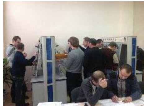
Рис. 2 – В науково-дослідній лабораторії мехатроніки та робототехніки