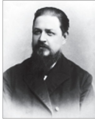
Фотопортрет І. Каманіна (1880–1890-і роки).

Протягом 45-ти років І. Каманін працював у Київському центральному архіві давніх актів (КЦАДА), і сучасники не уявляли собі цієї установи без нього. Саме архівознавчі студії визначили тематику більшості його наукових праць, а доступ до величезного масиву архівних документів уможливив запровадження до наукового обігу важливих, раніше невідомих джерел з історії України, Росії, церкви, національних меншин тощо. Багатогранна особистість ученого знайшла свій вияв у великій за обсягом та тематично різноманітній спадщині, що налічує близько 300 наукових праць та понад 720 кореспонденцій. Однак, у сучасній історіографії учений і досі залишається дослідником «другого плану».