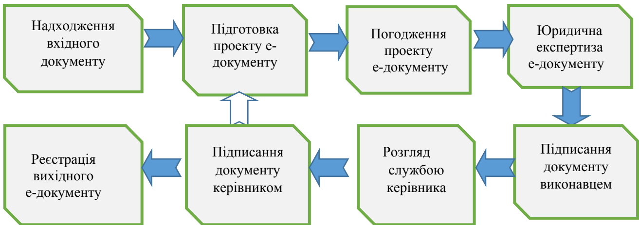
Рис 2. Технологія роботи з документом в документаційній системі

Технологія роботи з документом в ІАС включає надходження вхідного документу від керівника до виконавця, підготовку проекту е-документу, погодження проекту, його юридичну експертизу, підписання проекту документу відповідальною особою, розгляд документу службою керівника, його підписання керівником та реєстрацію вихідного документу (див. рис 2).