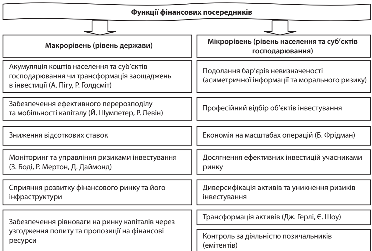
Рис. 3. Функції фінансових посередників в залежності від рівня їх діяльності

На ринку цінних паперів призначенням фінансових посередників є емісія, купівля та продаж цінних паперів. Також вони надають послуги зі зберігання, обігу, котирування та зміни прав власності.