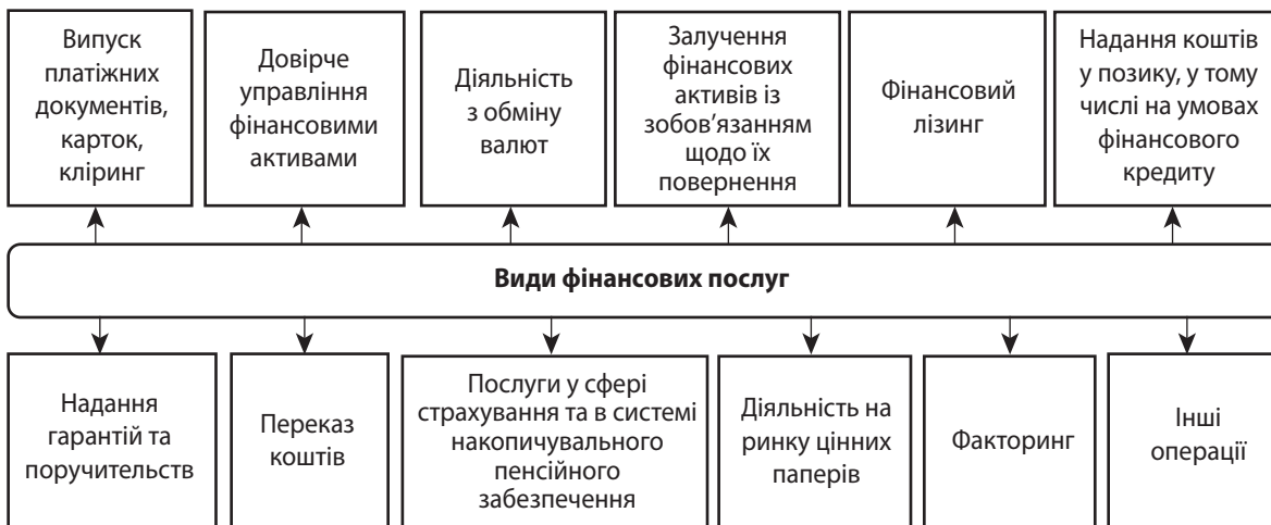
Рис. 2. Види фінансових послуг в Україні

У нашому визначенні поняття «фінансовий посередник» робимо наголос на те, що це фінансова установа, яка має статус як прибуткової, так і неприбуткової організації з огляду на те, що Закон України «Про фінансові послуги