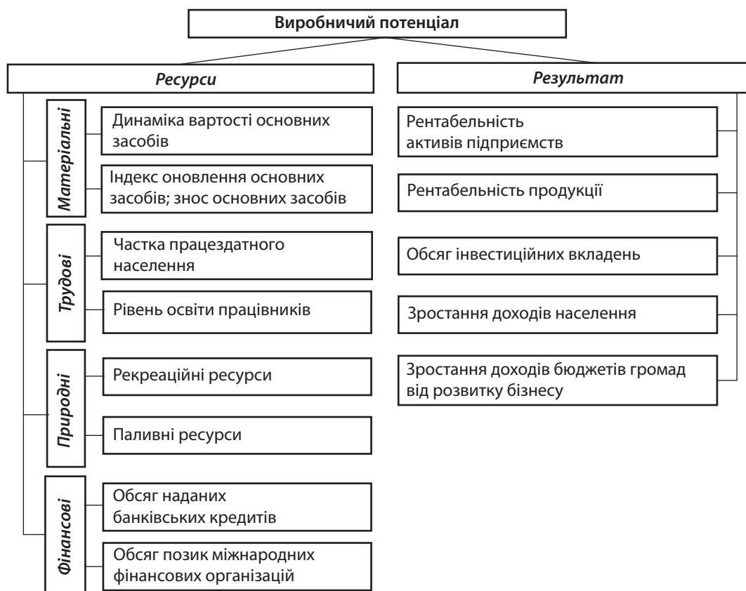
Рис. 3. Складові оцінки та аналізу виробничого потенціалу

Базову основу ринкового потенціалу регіону формує існуюча ринкова інфраструктура. Від стану ринкової інфраструктури залежить потенціал стану трьох інших складових – виробничої, споживчої та інноваційної. Наявність розвинутої сучасної ринкової структури безпосередньо впливає на темпи зростання виробництва, інноваційної діяльності та поживлення ринку споживання.