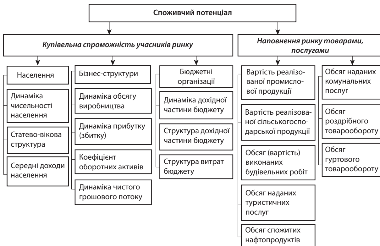
Рис. 2. Складові оцінки та аналізу споживчого потенціалу

Також Толпежніков Р. О. і Маматова Л. Ш. вважають, що виробничий потенціал – це максимально можливий обсяг продукції, який спроможна вигото-