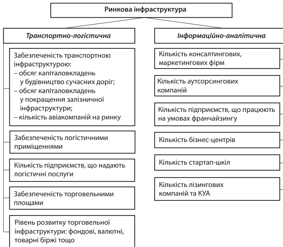
Рис. 4. Складові оцінки та аналізу ринкової інфраструктури

Таким чином, на основі запропонованих показників визначається інтегральна оцінка ринкового потенціалу загалом. Для цього доцільно застосовувати методологічний інструментарій розрахунку інтеграційного показника, що є темою окремого дослідження.