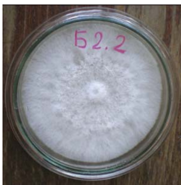
Рис. 3. Колонія Pleurotus ostreatus на живильному кукурудзяному агаризованому середовищі на 9-ту добу культивування з додаванням біогумату в концентрації 10^{-2}\% (B2)

Під час проведення якісних кольорових реакцій на поверхні колоній на наявність фенолоксидаз (лакази, тирозинази, пероксидази, цитохромоксидази) спостерігався позитивний ефект, тобто поява відповідного забарвлення на всіх варіантах живильних середовищ, що свідчить про стабільність фізіологічних властивостей міцелію P. ostreatus , що культивувався із застосуванням стимуляторів росту.