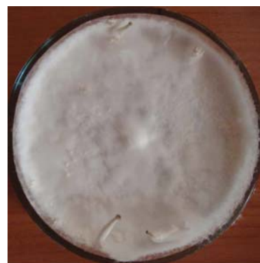
Рис. 4. Примордії Pleurotus ostreatus