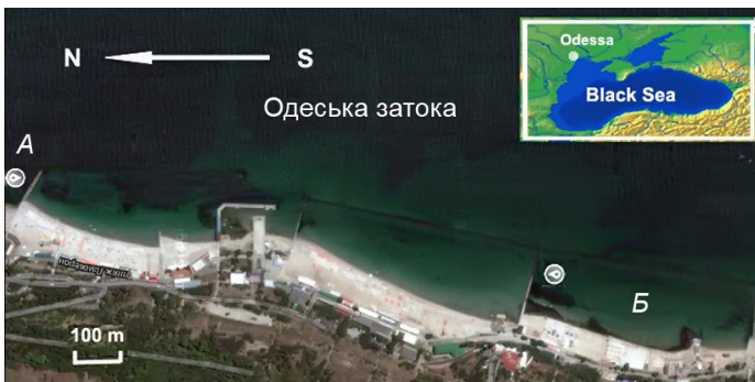
Рис. 1. Район відбору проб біля мису Ланжерон (Одеська затока, пн.-зах. частина Чорного моря), де проводили дослідження: А – відкрита акваторія із вільним водообміном з морським простором; Б – напівзакрита зануреним хвилеломом акваторія пляжу з уповільненим водообміном. Білими мітками відмічено траверси, з яких відбирали проби морської води і молюсків