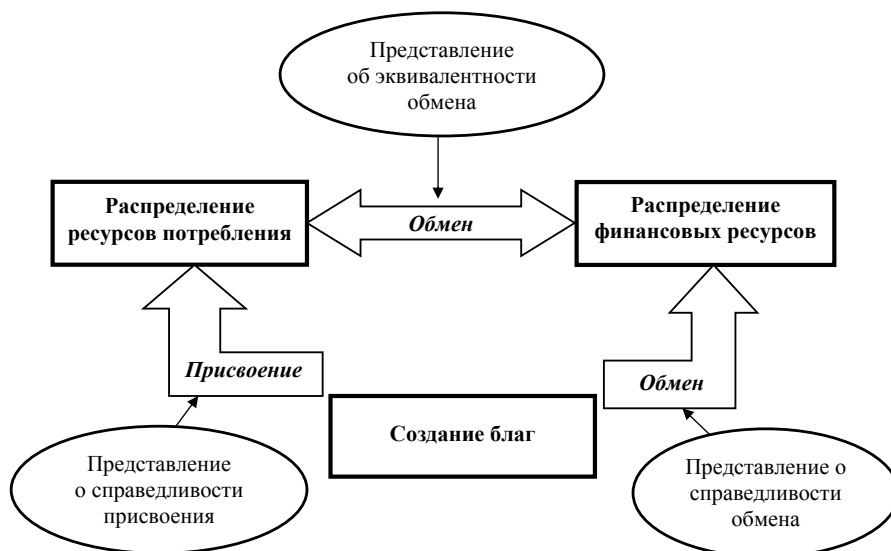
Рис. 1. Факторы возникновения протестного поведения экономических субъектов

– протестное поведение. Причиной протестного поведения может быть особое отношение к производителю. Например, есть факты, что некоторые голландские покупатели отказываются приобретать автомобили немецкой марки «Opel» лишь на том основании, что во времена Второй мировой войны германские войска оккупировали Нидерланды. Однако, как правило, массовый характер протестное поведение субъектов обмена приобретает по другим причинам. Для их выяснения воспользуемся схемой, представленной на рис. 1.