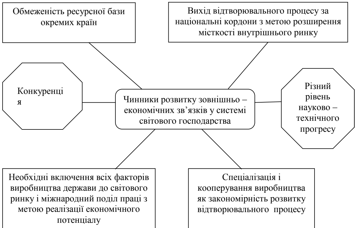
Рис.1. Чинники розвитку зовнішньоекономічних зв'язків [3]

обмеженість ресурсної бази окремих країн; розширення місткості внутрішнього ринку (рис.1).