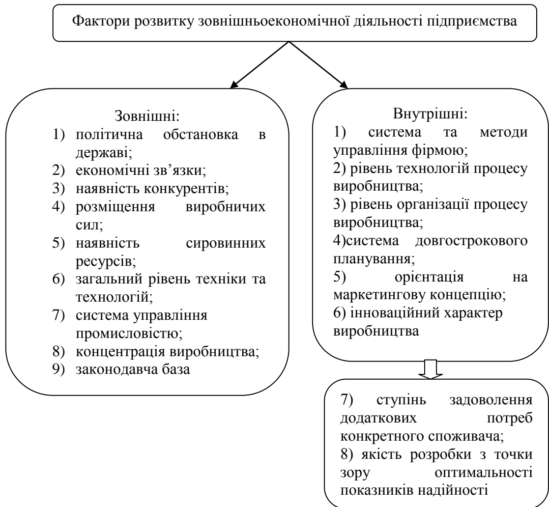
Рис.3. Система факторів розвитку зовнішньоекономічної діяльності [1]

Висновки та пропозиції. Історичний досвід свідчить про те, що область і її аграрний комплекс у недостатній мірі беруть участь у міжнародній торгівлі і не використовують тих переваг, які могла б дати така участь для підвищення ефективності виробництва. Зовнішньоекономічна діяльність в аграрному секторі тільки набирає темпів, розширюється, достатньо необхідного досвіду ще не нагромаджено.