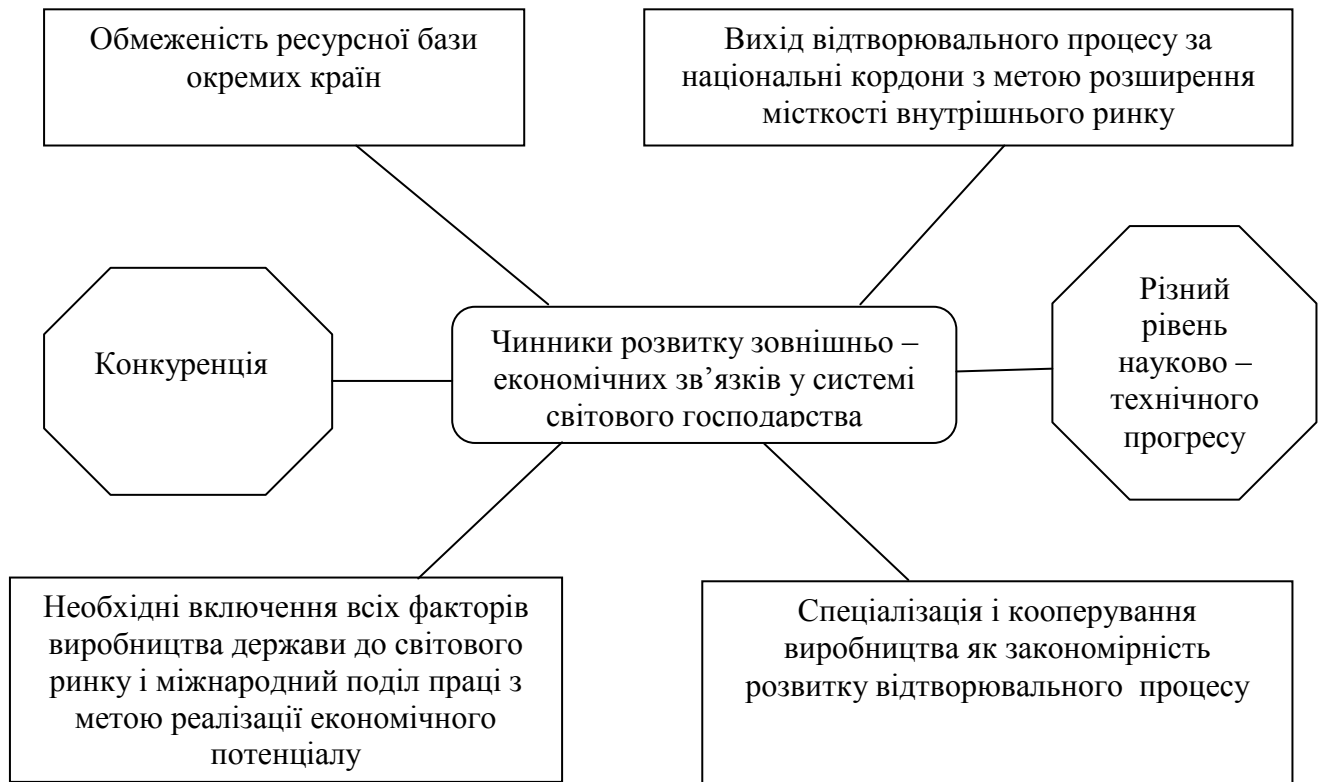
Рис. 1. Чинники розвитку зовнішньоекономічних зв'язків [3]

Чинники, що впливають на організацію зовнішньоекономічної діяльності підприємств, доцільно розбити на дві групи: зовнішні та внутрішні (рис.2). Такий підхід зручний тим, що дозволяє пов'язати їх із стратегічним менеджментом, основою якого є SWOT-аналіз. Перша частина цього аналізу – “сильні і слабкі сторони” підприємства - відтворює внутрішні чинники. Друга частина – “можливості та загрози” - пов'язана із зовнішніми чинниками.