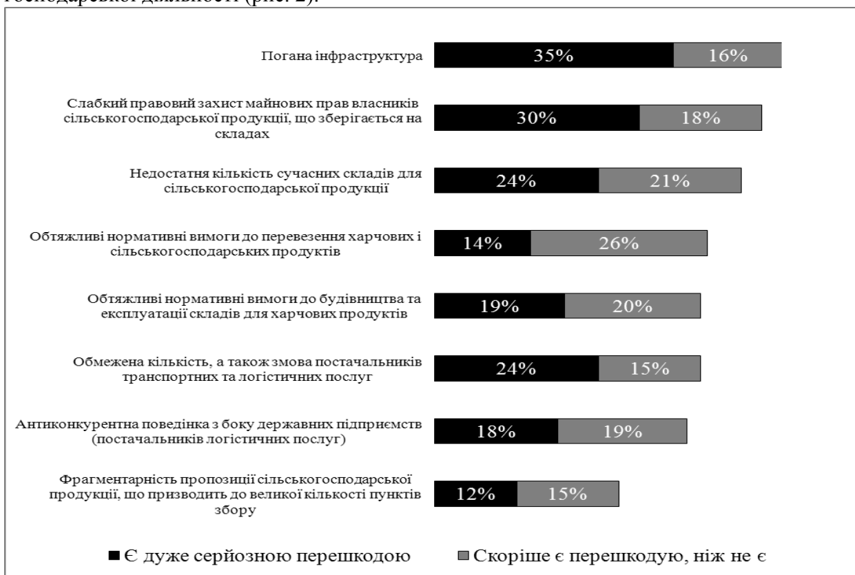
Рис. 2. Основні перешкоди для ефективного маркетингу та логістики в сільському господарстві [7, с. 77]

Підтверджують це і дослідження проведені іноземними фахівцями IFC «Інвестиційний клімат в Україні», який діє в нашій державі вже протягом 14 років. Він сприяє сталому економічному зростанню країн, що розвиваються, фінансуючи інвестиції, надаючи компаніям та урядам консультативні послуги, мобілізуючи приватний капітал на міжнародних фінансових ринках. Основному увагу в своїх дослідженнях вони приділили агропродовольчій сфері. Зазначивши, що низька якість послуг із післязбирального транспортування й логістики обумовлюється поганим станом транспортних засобів і складських приміщень, низьким рівнем захисту прав власності фермерів на сільгосппродукцію, що зберігається на зовнішніх елеваторах, незадовільним станом системи складських свідоцтв. Згідно з дослідженням IFC, існуюча нормативна база, що регулює надання послуг із післязбирального транспортування й логістики сільськогосподарської продукції, є ще однією вагомою перешкодою для розвитку галузі. Це підтвердили майже 80% опитаних підприємств, близько 45% сільгосппідприємств вказали на відсутність складських приміщень як на ще одну перешкоду для здійснення господарської діяльності (рис. 2).