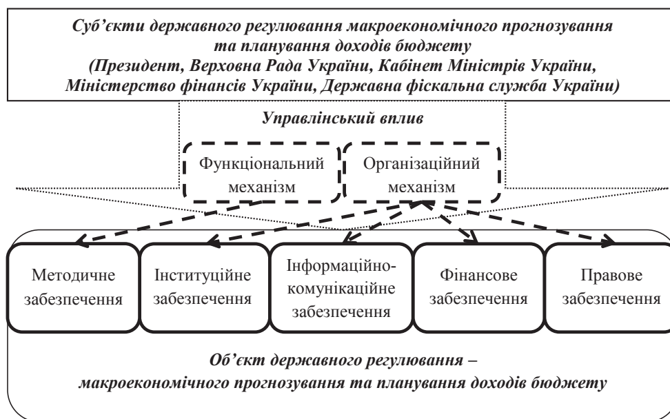
Рис. 2. Модель державного регулювання макроекономічного прогнозування і планування доходів бюджету

Правове забезпечення макроекономічного прогнозування і планування доходів бюджету – це сукупність чинних правових норм, спрямованих на формування умов для ефективної функціональної реалізації процесу макроекономічного прогнозування і планування доходів бюджету та його організації.