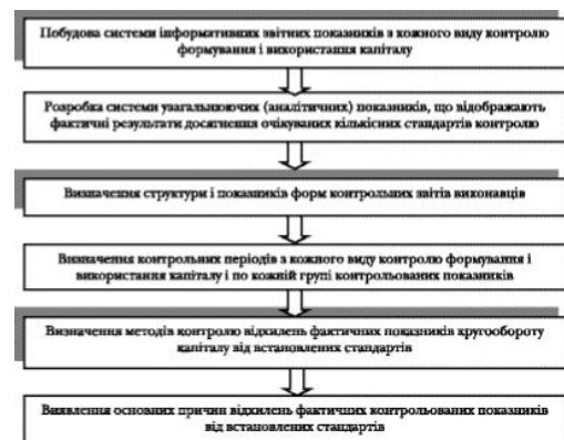
Рис. 2. Етапи побудови системи дослідження контрольованих показників, пов'язаних з кругообігом капіталу