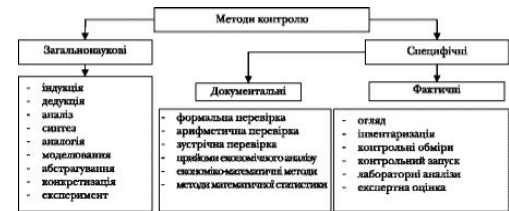
Рис. 3. Класифікація методів господарського контролю [4], [7], [12]

Т.А. Бутинець суттєвих відмінностей між методами дослідження та методами практичного здійснення контролю немає [4, с. 50]. Тому методи контролю кругообігу капіталу можна узагальнити, як показано на рис. 3.