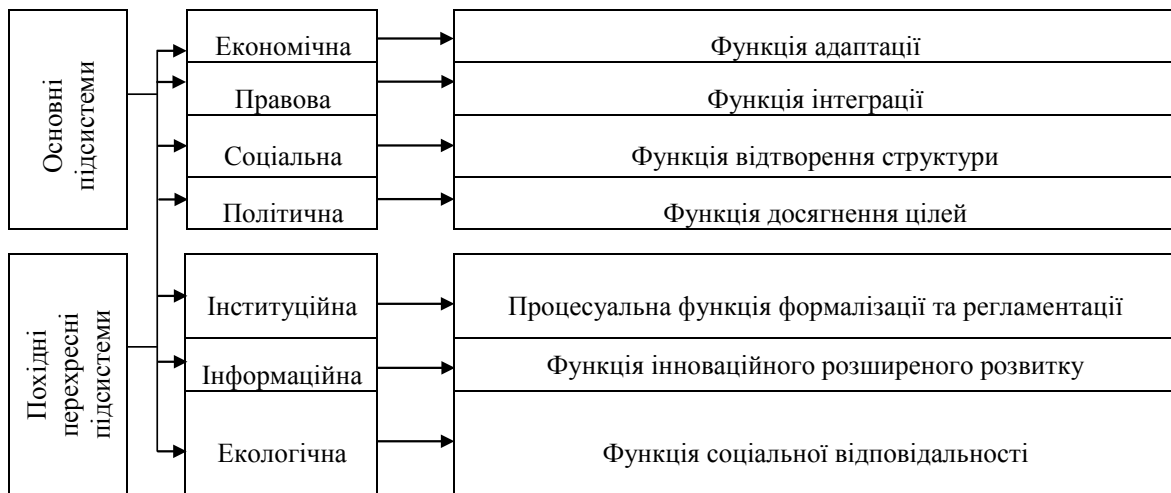
Рис. 2. Підсистеми ділового середовища та їх функції

Очевидно, що соціальна підсистема, котра розглядається при побудові прототипу ділового середовища, це – функція відтворення структури – підсистема вірувань, моралі, органів соціалізації, включаючи сім'ю та інститути освіти. Соціальна підсистема за структурою складніша, ніж інші підсистеми. Вона включає в себе безліч елементів, неувага до яких з боку підприємця може мати нега-