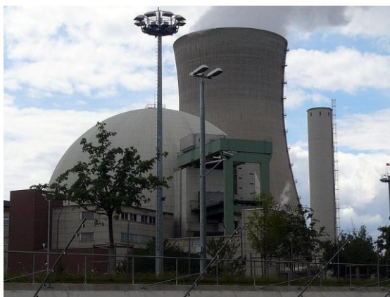
Рис. 4. Защитная полусферическая оболочка АЭС Grafenrheinfeld в Германии (1981 г.)

Двойные оболочки из металла и железобетона характерны для ряда АЭС США и всех АЭС Германии (рис. 4), построенных в конце 1970-х, в 1980-е гг.