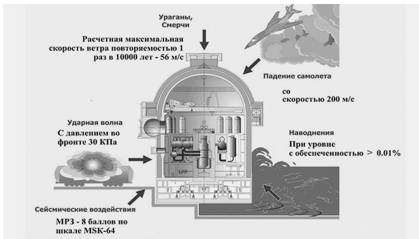
Рис. 5. Внешние воздействия, учитываемые при проектировании защитной оболочки реакторного отделения [7]

Внешняя железобетонная оболочка предназначена для защиты реакторных установок от внешних опасностей, в том числе взрывной волны и падения самолета (рис. 5).