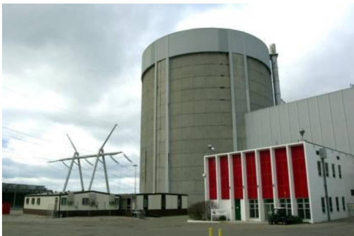
Рис. 1. Защитная оболочка АЭС Palisades в США (1971 г.)

Впервые предварительно-напряженные оболочки стали применять с начала 1970-х годов в США. Palisades (пуск в 1971 г.) – первая АЭС при строительстве которой было реализовано полное предварительное напряжение стен и купола контейнмента (рис. 1). Диаметр одинарной оболочки – 35 м, высота – 58 м (включая купол), толщина в цилиндрической части – 1100 мм (стальная облицовка – 6,4 мм), в сферической – 910 мм.