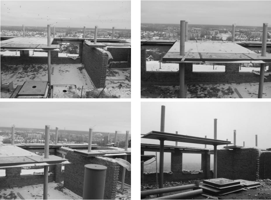
Рис. 3. Монтаж сталезалізобетонного безбалкового перекриття

Враховано, що при відповідній якості розрахунку й конструювання системи з безбалковим каркасом мають високі показники надійності та економічності. Тому розрахунки окремих плит для безбалкового перекриття проводились за допомогою програмного комплексу із використанням ПЕОМ за методикою, що наведена в [3, 4], а також з використанням інженерних підходів до розрахунку й конструюванню.