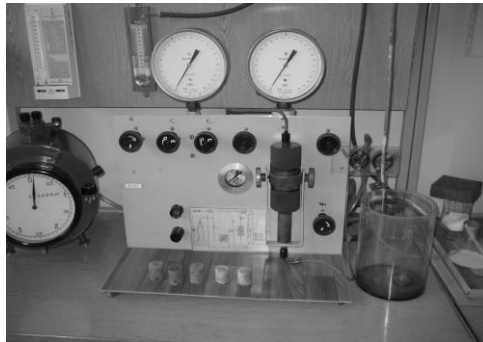
Рис. 3. Прилад ГК-5 для визначення абсолютної газопроникності при стаціонарній фільтрації

Дослідження проникності ґрунтоцементу (як штучної гірської породи) зроблено газоволюметричним методом на приладі ГК-5 (рис. 3) згідно зі стандартом [8] на лабораторній базі ДП «Укранаукагеоцентр» (м. Полтава).