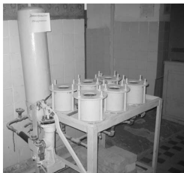
Рис. 1. Установка для випробувань зразків методом «микрої плями»

При випробуваннях методом «микрої плями» застосовували зразки-циліндри діаметром та висотою 150 мм. Після виготовлення зразки зберігалися протягом 28 діб у вологих умовах, далі випробовувалися за методикою стандарту [6]. Після встановлення зразків у гнізда установки (рис. 1)