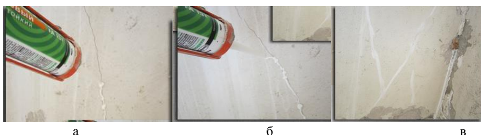
Рис. 3. Фрагменты заделки мелких трещин «паутинок»:

обеспылевают и грунтуют. После этого трещины заделывают акриловым силиконизированным герметиком, как показано на рис.3.