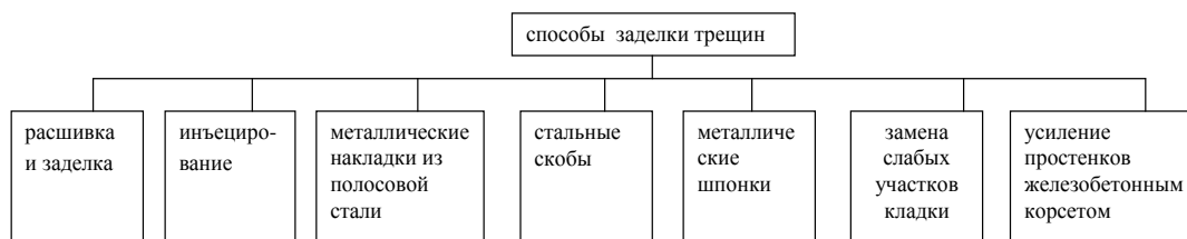
Рис. 2. Классификация заделки трещин в конструкциях ручным способом

Современные способы заделки трещин выполняются механически, но и не исключают применения ручного труда [4]. Рассмотрим некоторые технологические способы, которые используют при заделке. На рис. 2 представлена классификация заделки трещин в конструкциях ручным способом.