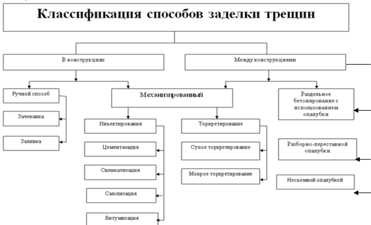
Рис.1. Классификация современных способов заделки трещин

Как видно из классификации заделывание трещин в конструкциях выполняется ручным или механизированным способами. При ручном способе заделка трещин, с небольшой шириной их раскрытия, зачастую выполняется зачеканкой или заливкой растворной смеси [3, 4].