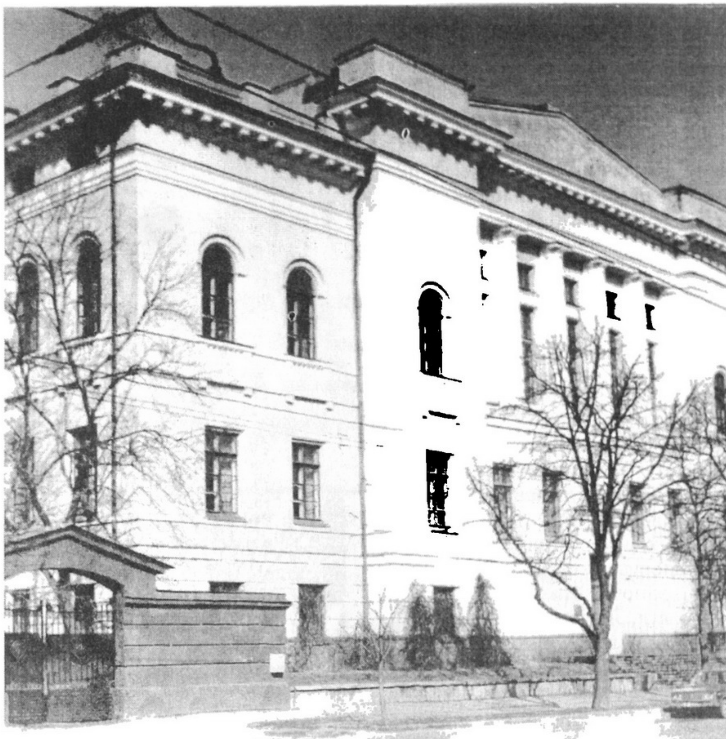
Бібліотека Київського університету імені Тараса Шевченка, Володимирська, 58.