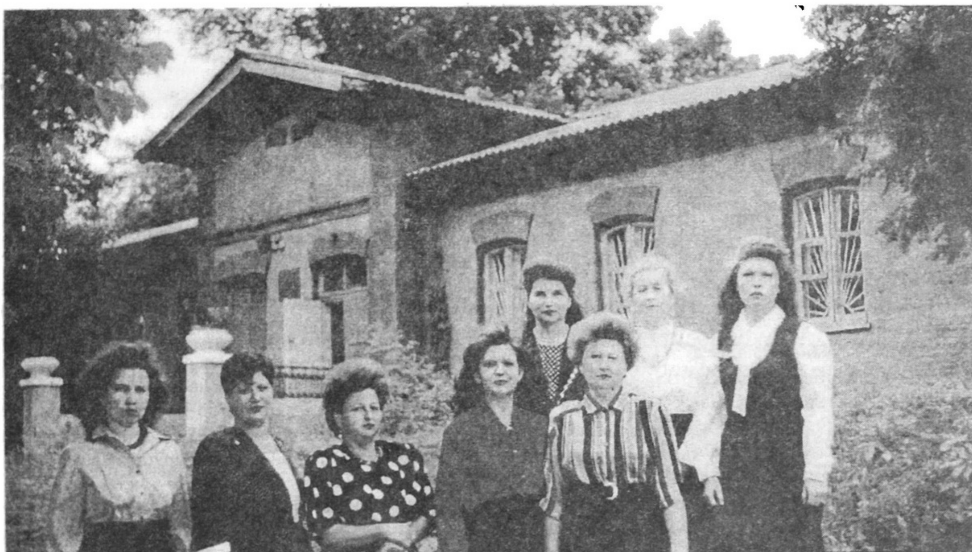
Колектив НТБ Дніпродзержинського металургійного комбінату.

Б ібліотеку засновано 1897 р. в с. Кам'янське (нині Дніпродзержинськ) при заводі. Вона існувала на щомісячні внески читачів. Адміністрація заводу ніяких асигнувань не виділяла. За статутом фондом мали право користуватися тільки інженери та службовці.