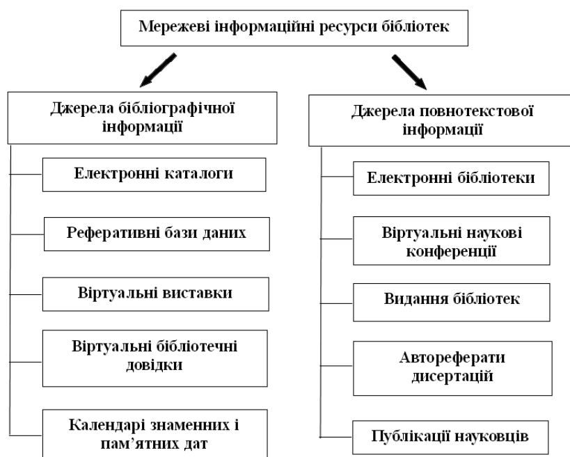
Рис. 1. Види мережних електронних ресурсів бібліотек