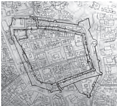
Рис. 2. Фрагмент плану серед-містя Львова з оборонними мурами XVIII ст. (за Я. Вітвіцьким) [5]