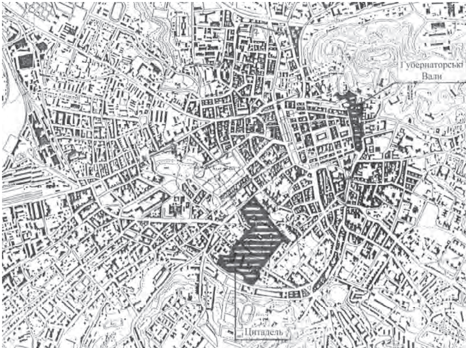
Рис. 1. Ситуаційна схема розташування об'єктів оборонної архітектури у центральному ядрі Львова (рис. В. Дідика)