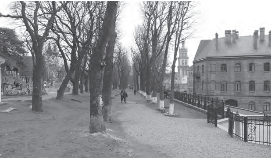
Рис. 5. Львів. Губернаторські вали. Композиційно збереглася чотирирядна каштанова алея. Вид від вул. М. Кривоноса (фото В. Дідика, січень 2014)

У Львові, як у столиці провінції на задвірках імперії, процес знесення оборонних валів і мурів почався у другій половині XVIII ст. — з 1770 р. і тривав до 1825 р., тобто раніше, ніж у Відні, де «ідея заміни розібраних міських укріплень парадними міськими бульварами досягла свого логічного завершення у показній Рінгштрассе, побудованій навко-