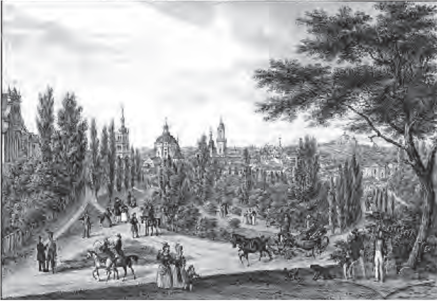
Рис. 4. Губернаторські вали. Літографія Карла Ауера, 1846–1847 рр. [2, с. 227]