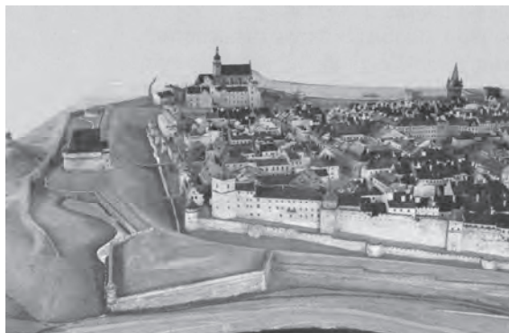
Рис. 3. Вид східних оборонних мурів Львова з валами (фото з Пластичної панорами Львова (за Я. Вітвіцьким) [5]

систему середньовічних мурів. З другої половини XVIII ст. у багатьох європейських містах оборонні стіни розбираються, а вали розрівнюються і за їх рахунок засипають рови з водою. Можна вважати, що Львів у Австро-Угорській імперії у якомусь сенсі був ніби містобудівним полігоном.