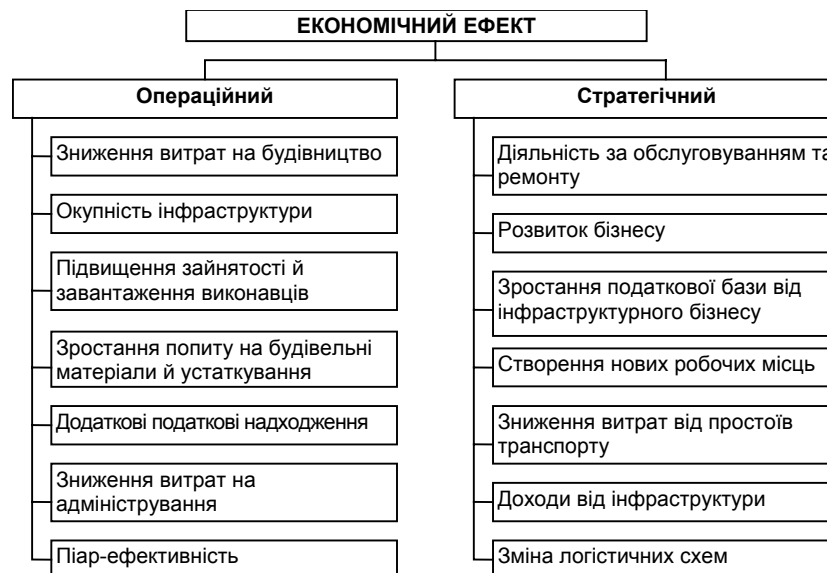
Рис. 2. Схема оцінювання вигод для території при реалізації проектів нового дорожнього будівництва

Для оцінювання проекту стандартну формулу оцінки NPV пропонується адаптувати до некомерційних проектів (проектів, чистий результат яких використовується для отримання соціального ефекту і зростання добробуту населення).