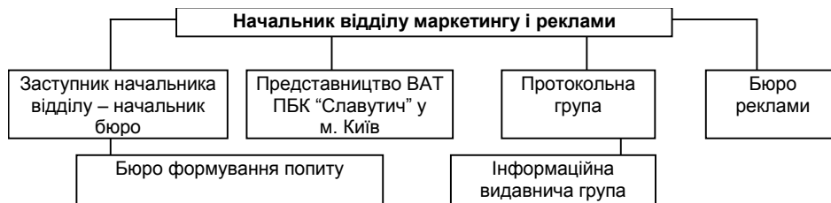
Рис. 1. Схема організаційної структури маркетингових підрозділів ПАТ ПБК “Славутич”

кетингової діяльності приділяється дуже велика увага. На підприємстві ПАТ ПБК “Славутич” найбільш ефективний підхід передбачає формування окремих центрів прибутку, при кожному з яких створюється окрема маркетингова служба, що враховує особливості та специфіку виробництва, та продукція, котра виробляється. Таким чином, це завдання на ПАТ ПБК “Славутич” вирішується шляхом створення відділу маркетингу й реклами і безпосередньо в кожному виробництві відділів маркетингу. Схему оргструктури маркетингової служби подано на рис. 1.