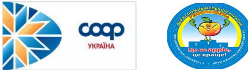
Рис. 3. Фірмовий знак Укоопспілки та емблема акції "3 турботою про українське!"

ймав корпоративний бренд. Тобто, щоб корпоративний бренд виступав у ролі стратегічного бренду, що лежить в основі всієї системи портфелю брендів. Це пояснюється передусім тим, що без корпоративного бренду є не доцільним формування ВТМ [4]. У зв'язку з цим, для кооперативних маркетів доцільним є поєднання назви корпоративного бренду й private labels та використання фірмового знаку мережі на упаковці власного товару (рис. 3), оскільки подібна політика використовується для товарів нижчого й середнього цінового сегментів.