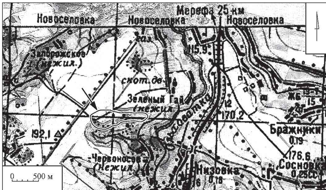
Рис. 1. Карта расположения Червоносовского городища Fig. 1. Location map of Chervonosovskoho settlement